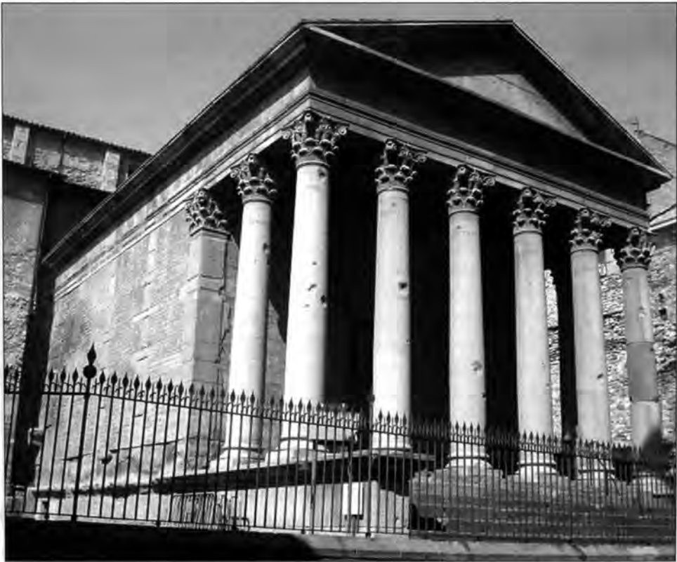
Làmina 11. El temple d'Auso (Vic)

El municipi d'Auso controlava un ampli territori ( ager ) en què els establiments rurals conreaven cereals i es dedicaven també a la ramaderia, principals activitats econòmiques encara en l'actualitat. Encara no en coneixem gaire l'aspecte monumental; l'edifici més emblemàtic és el temple, del qual l'any 2007 es va celebrar el 125è aniversari del descobriment, en ser enderrocat el castell dels Montcada (làmina 11). Pel mòdul sembla que podem deduir que era un temple tetràstil, amb quatre columnes a la façana, encara que avui en veiem la restauració amb sis. És una obra arquitectònica singular a Catalunya, car presenta paraments d' opus africanum , segons una tècnica constructiva pròpia del nord d'Àfrica, on els púnics l'empraren a bastament i, després d'ells, els romans. En la forta expansió urbanística que experimentaren les ciutats nord-africanes el segle II d.C., és molt present l' opus africanum , que es caracteritza per cadenes de grans carreus entre els quals se'n disposen de petits i regulars. 14 Pel que fa a la