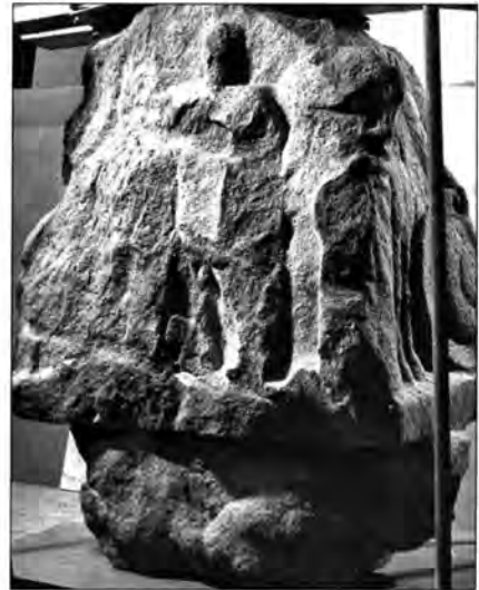
Làmina 9. Hèrcules a l'Olimp, acompanyat de Minerva

Es tracta, doncs, d'un monument complex d'una iconografia refinada i culta, amb paral·lels a Itàlia, que només es pot entendre en l'ambient de romanització que testimonia Osona d'ençà de finals del segle II a.C., amb una densitat de jaciments i de monuments del tot fora de sèrie.