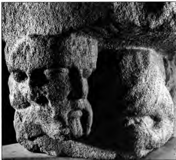
Làmina 6. Monstre tricèfal de Malla

tacte dels pobladors indígenes i dels nouvinguts d'Itàlia en una zona destacada com a eix de comunicacions. 8