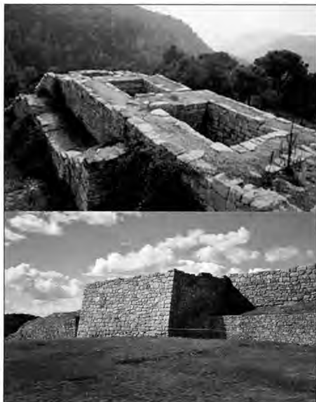
Làmina 1. La fortificació del Turó del Montgròs (el Brull)

amb fossat, dotada de cossos de guàrdia ( philacteria ) i torres de defensa que només troba explicació com a fortificació de l'estratègic pas de control de la costa vers l'interior ubicat en aquest punt del Montseny.