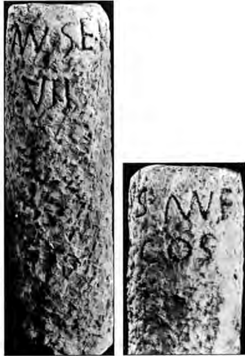
Làmina 2. Mil·liari de Tona. Museu Episcopal de Vic