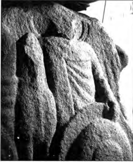
Làmina 7. Els dos costats menors, amb genis alats, del monument de Malla