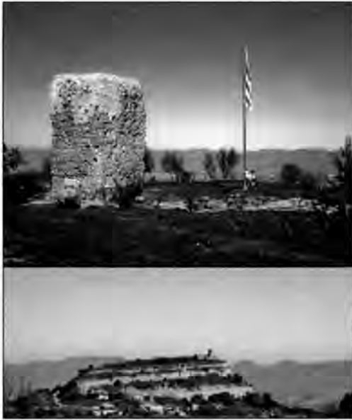
Làmina 10. Turó del Castell amb l'església de Sant Andreu i la torre (Tona)

caementicium , sense que avui vegem els carreus que la folraven exteriorment, objecte de reaprofitament al llarg dels segles (làmina 10). Creiem que pot tractar-se d'un monument funerari turriforme de planta quadrangular al qual caldrà dedicar un estudi monogràfic que posi en ordre les troballes arran de les excavacions dels anys 1972 i 2003, tal com s'ha fet a Tona, amb òptims resultats, al Camp de les Lloses. S'ha anat considerant tradicionalment una torre de l'alta edat mitjana amb funció de guaita, 10 però la tècnica constructiva i la manca de finestres o d'obertures en tot el parament, entre altres raons, fa que dubtem d'aquesta interpretació i pensem que és encara un tema obert pendent d'una investigació aprofundida.