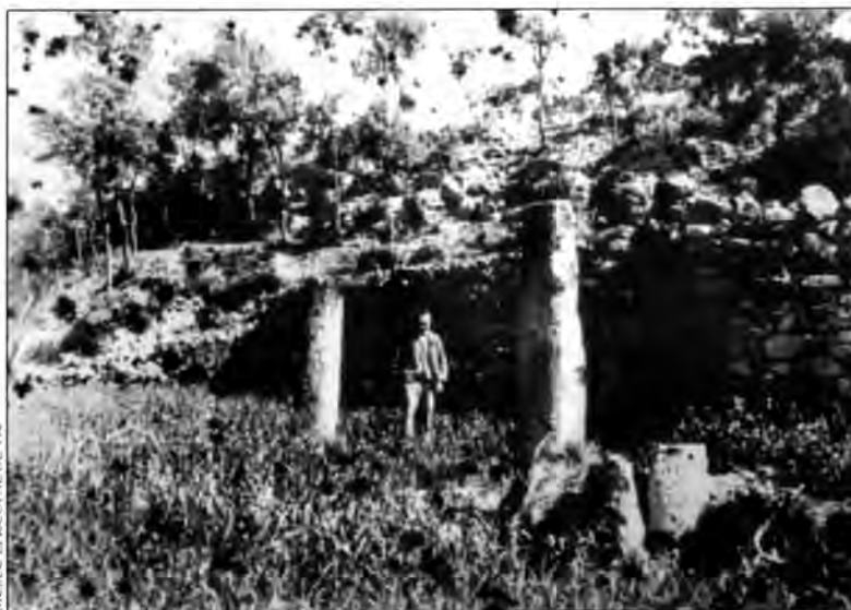
Làmina 12. Quatre mil·liaris encara in situ abans de l'abril del 1891

cronologia del temple de Vic, sembla que el podem ubicar entre finals del segle I i començaments del segle II d.C., però estudis en curs sobre qüestions tècniques i estilístiques –arran de la celebració que el Patronat d'Estudis Osonencs organitzà amb motiu del 125è aniversari de la descoberta del temple 15 en permetran afinar i confirmar millor la datació.