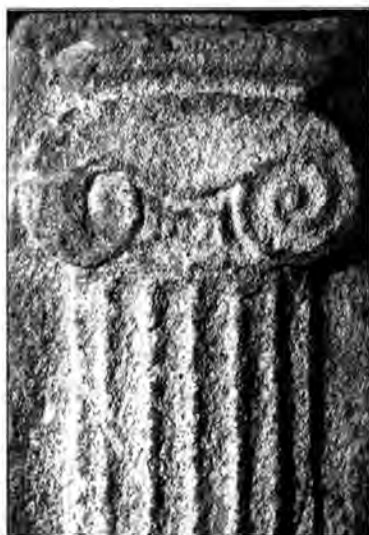
Làmina 5. Capitell jònic del monument de Malla