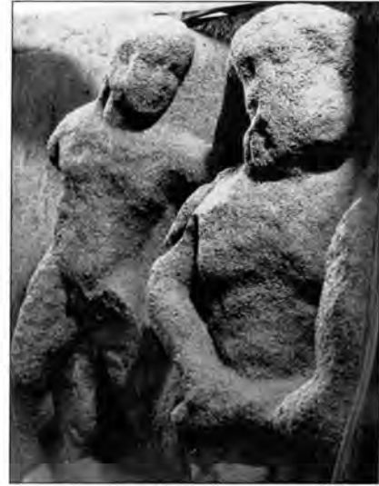
Làmina 8. Hèrcules, Nessos i Deianira de Malla