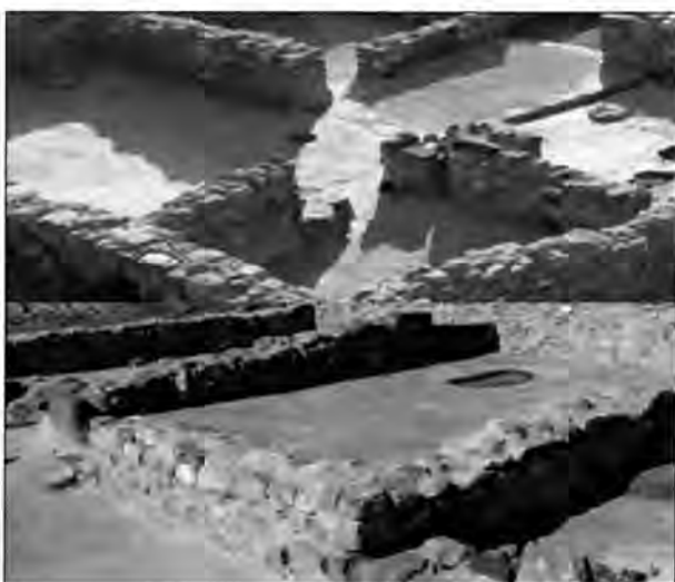
Làmina 4. Estructures republicanes del Camp de les Lloses (Tona)

El Camp de les Lloses tingué una llarga ocupació des del segle VIII a.C., però la fase més important correspon precisament al mateix moment del traçat viari de Mani Sergi, ja que a partir dels voltants de l'any 120 a.C. s'hi estableix un vicus de caràcter militar, caràcter que també sembla que té la via de Mani Sergi, com hem esmentat més amunt. Aquest assentament es dedicà principalment a la metal·lúrgia del ferro i també del coure i del bronze (làmina 4). La via i l'establiment del Camp de les Lloses estan íntimament lligats i relacionats, i ens fan palès el procés de romanització del territori, amb un con-