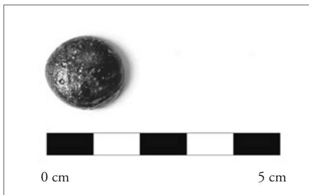
FIGURA 6. Fitxa de pasta de vidre blau.

– 7 fitxes més de pasta vítria: 2 de blaves, 3 de blanques i 2 de daurades, de la mateixa forma i funció que les anteriors.