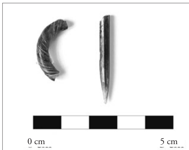
FIGURA 3. Dos fragments de petites barres de pasta de vidre, segurament d'agulla de filosa d'anell.

– Un peu de copa, de vidre bufat, potser tipus Isings 111, d'època tardana i que perdura en l'edat mitjana (MASV 5842) (fig. 2).