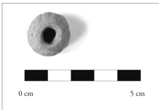
FIGURA 4. Dena de collaret amb gallons.

– Una dena de collaret de pasta de vidre de dos colors, blau marí i groc, que dibuixen cercles al voltant de la perforació central. És de forma tronco cònica, amb les dues bases planes i l'espàtlla convexa. Presenta un lleuger trenc. Fa 21 mil·límetres de diàmetre màxim (publicada per Mir 2004, 82) (MASV 5828) (fig. 5).