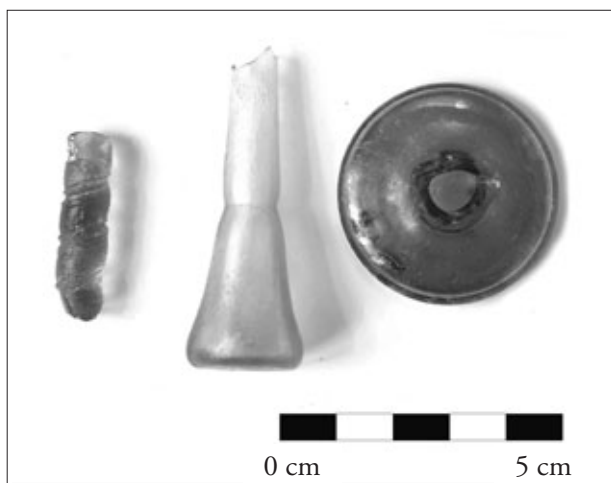
FIGURA 2. Barreta de vidre. Ungüentari forma Isings 28. Peu de copa.