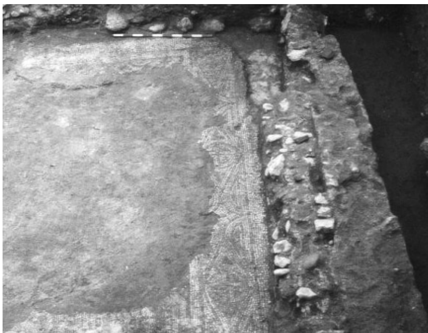
Figura 4 i 5: Detall dels mosaics durant el procés d'excavació