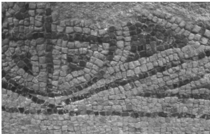
Figura 6 i 7: Detalls dels mosaics, una vegada extrets del jaciment