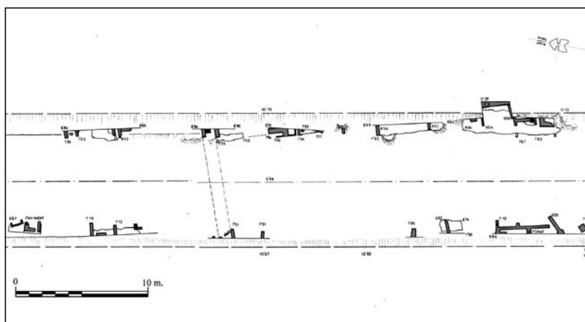
Figura 2. Vista general del canal de l'Ebre a l'àrea on s'efectuaren els treballs arqueològics