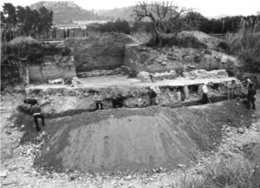
Figura 3. Vista general de l'àrea dels balnea, on foren trobats els mosaics