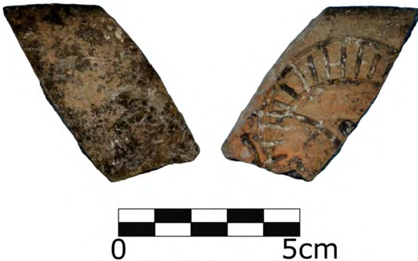
Figura 1. Fotografía del fragmento de molde por ambos lados.

de mayor tamaño. También se observan abundantes fisuras alargadas que confieren a la pasta un aspecto laminado. La decoración del molde se puede encuadrar dentro de la serie de círculos dobles que caracterizan el tercer estilo decorativo de López Rodríguez (1985). Se conservan parcialmente dos de estos grandes círculos secantes, el de mayores dimensiones compuesto por dos circun-