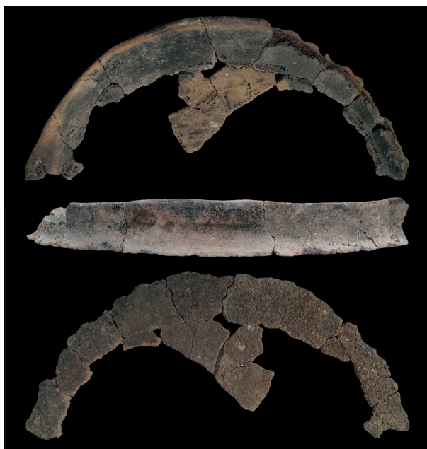
Fig. 7 : tajine provenant d'Althiburos

premier millénaire av. J.-C., notamment à partir du VIII e s. av. J.-C. Cela semble indiquer une continuité essentielle des pratiques culinaires, aspect très important de tout système culturel. Ce type d'objet est également présent dans les sites puniques, comme à Carthage même, mais dans des volumes clairement moindres, dans la mesure où on peut le dire à la lumière des données actuelles 39 .