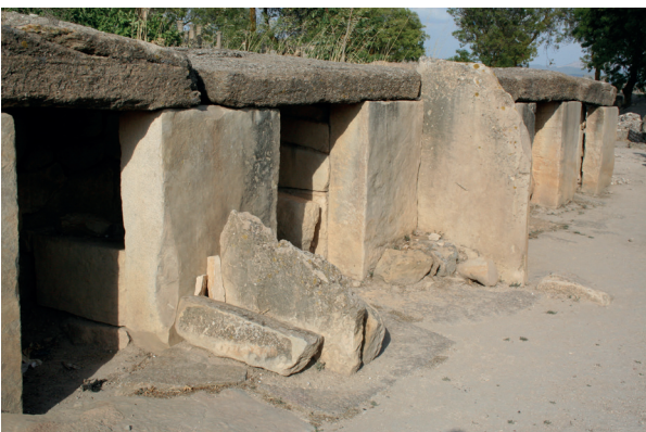
Fig. 10 : monument de Makthar. (Photo : https://fr.wikipedia.org/wiki/Site_archéologique_de_Makthar ).

Pour ce qui est de la langue, finalement, toutes les inscriptions préromaines trouvées dans les alentours d' Althiburos sont libyques et leur date se situerait autour de 100 av. J.-C., sans pouvoir être plus précis, elles indiquent en même temps qu'on continuait à utiliser des noms libyques 45 . Quoi qu'il en soit, ces documents attestent clairement que la langue courante dans les abords et au-delà des limites de la ville était bien le libyque, leur langue autochtone, alors que dans la ville on utilisait le punique, et l'écriture néopunique, dans les inscriptions officielles et rituelles. Il n'est point inutile de rappeler ici que la carte de répartition des inscriptions libyques montre qu'elles sont quasiment absentes du territoire de Carthage proprement dit 46 .