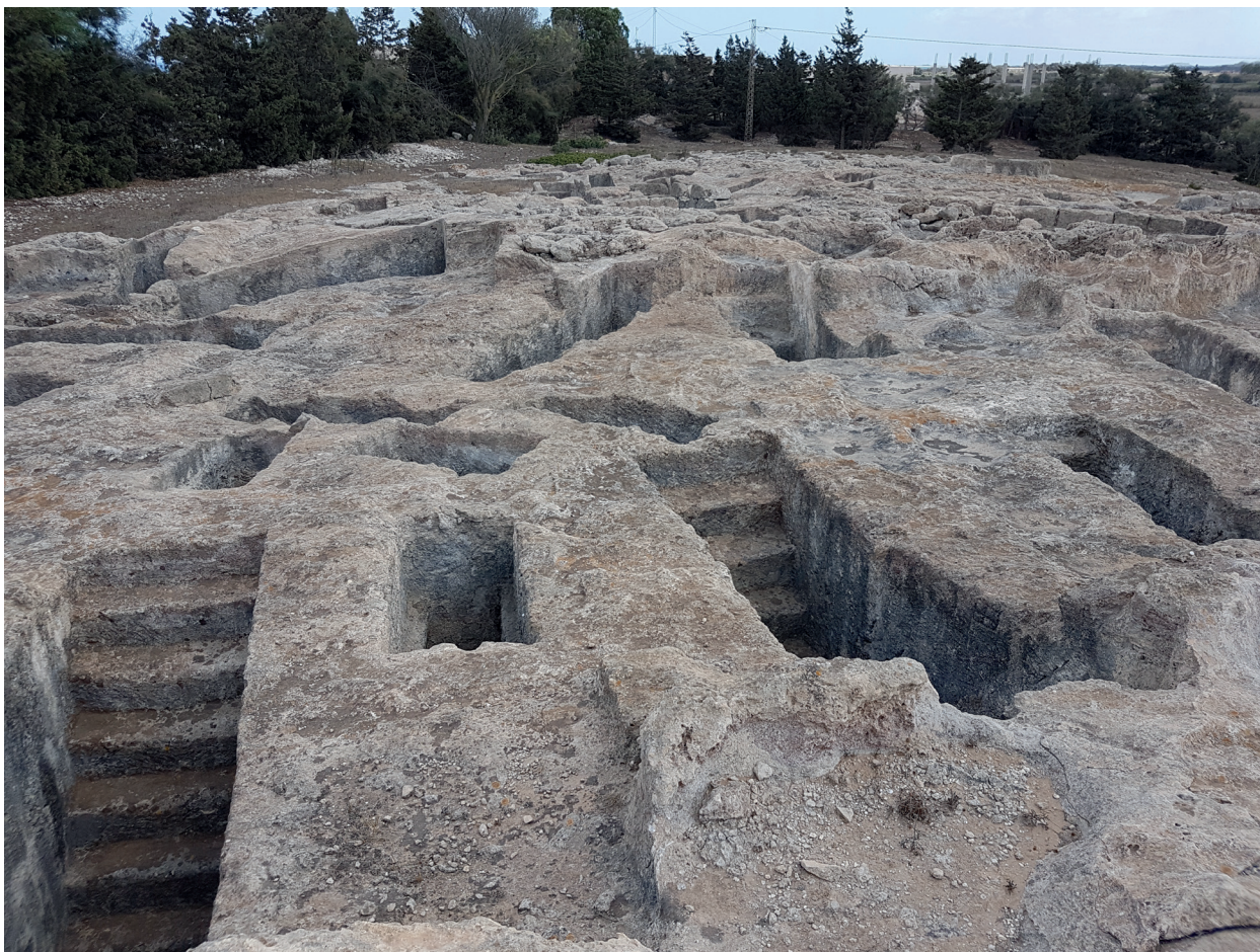
Fig. 2 : hypogées puniques de Kerkouane

Et ce pour de nombreuses raisons, y compris, par exemple, les similitudes avec les formes funéraires attestées dans de nombreux sites extra-africains qui, pour des raisons indépendantes (telles que le témoignage de sources anciennes, la documentation épigraphique ou d'autres éléments de la culture matérielle) peuvent être considérés comme puniques. De même, nul ne peut sérieusement douter que les personnes enterrées dans les mégalithes de Djebel Mazela 17 ou d' Althiburos -el Ksour 18 étaient culturellement très différentes de celles des villes puniques susmentionnées, compte tenu non seulement de la morphologie des tombeaux, mais aussi des rituels funéraires (comportant souvent, par exemple, le décharnement des corps) et du mobilier