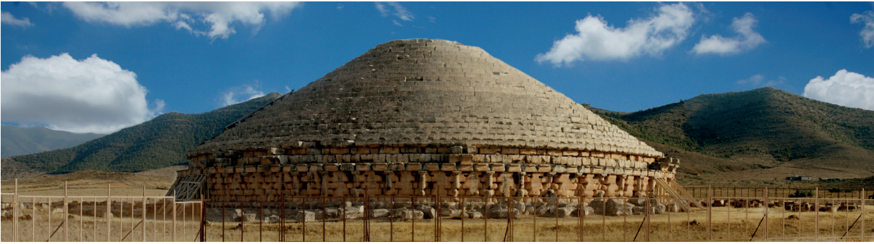
Fig. 8 : le Medracen

Mais s'en distinguent peut-être les membres de l'aristocratie enterrés dans les grands monuments mégalithiques, comme à Ellès (Fig. 9) ou à Makthar (Fig. 10), par exemple, ou dans des bazinas comme le monument 242 d' Althiburos 44 , et qui datent bien des derniers siècles du I er millénaire av. J.-C.