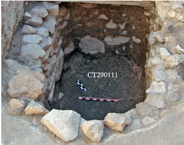
Fig. 6 : citerne d'Althiburos. (Photo Joan Ramon).

Comme nous l'avons noté dans des travaux précédents 34 , il y a des raisons de croire qu'Althiburos ne faisait pas partie du territoire contrôlé par Carthage, bien que la frontière avec la Numidie indépendante n'en ait pas dû être trop éloignée. Elle peut donc être représentative de la réalité d'une ville secondaire, habitée principalement - mais pas exclusivement - par une population indigène qui a maintenu un contact important avec le monde punique. Dans les paragraphes qui suivent, nous examinerons certaines des caractéristiques archéologiques les plus typiques de cette population, plus particulièrement celles qui peuvent indiquer l'existence de traditions culturelles et de pratiques économiques différentes de ce que nous connaissons pour le monde punique.