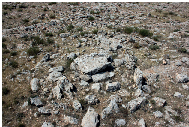
Fig. 3 : dolmen de la nécropole d'Althiburos-el Ksour.