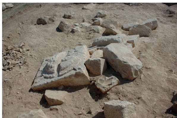
Fig. 14b. : monuments royaux numides : Djebel Berouag. (Photo Nabil Kallala).

Les grands monuments funéraires des rois (et peut-être de la haute aristocratie numide), si différents des formes traditionnelles de cette civilisation, attestent probablement de cette volonté d'affirmation – ou tentative d'affirmation – de la monarchie par rapport aux chefs des tribus et à l'ensemble de la population ; ils adoptent de ce fait des formes hellénistiques, notamment le Medracen , qui semble avoir imité le tombeau d'Alexandre. Il en va de même pour les mausolées-temples (ou grands autels) de Chimtou, de Djebel Berouag et de Kbor Klib (Fig. 14) ; ils affirment nettement, par leur visibilité – sur le sommet des hauteurs –, par leurs dimensions et par leur décor, le pouvoir des monarques et son caractère culturel à la fois étranger et surnaturel 53 . Dans un tel contexte, il est possible de penser que, pour affaiblir les structures tribales traditionnelles, les monarques avaient encouragé les élites urbaines à adopter des traits de culture punique, déjà bien acquises à elle, notamment dans le domaine de la religion, et tardivement dans certaines formes de consommation des aliments. Il s'agirait là aussi de souligner le statut supérieur de cette classe, sa culture raffinée (et bien entendu en partie étrangère, sans que cela mette en cause leur caractère essentiellement autochtone), par rapport au reste de la population, ainsi que leur rôle de plus en plus important dans la structure de l'État.