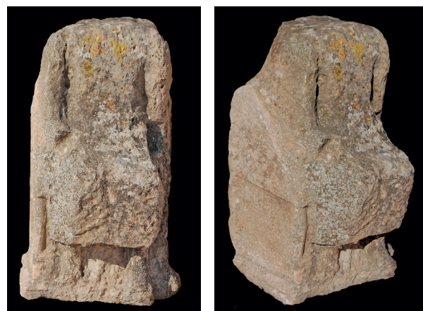
Fig. 11 : statue trônante. (Photo Équipe d'Althiburos).

probablement du III e s. av. J.-C. 47 ; l'institution du suffétat, mais en collège de trois, qui est une réminiscence libyque 48 ; l'usage du calendrier punique 49 ; le culte du dieu poliade Baal Hammon et son tophet ; faut-il rappeler tout de même que ce dieu phénico-punique a subi en terre numide une captatio libyque 50 (Fig. 13) ; en même temps, l'iconographie des stèles que révèle le tophet , et qui datent entre le II e s. av. J.-C. et le I er s. ap. J.-C., montre l'attachement des officines althiburitaines aux procédés stylistiques puniques et à la symbolique carthaginoise 51 .