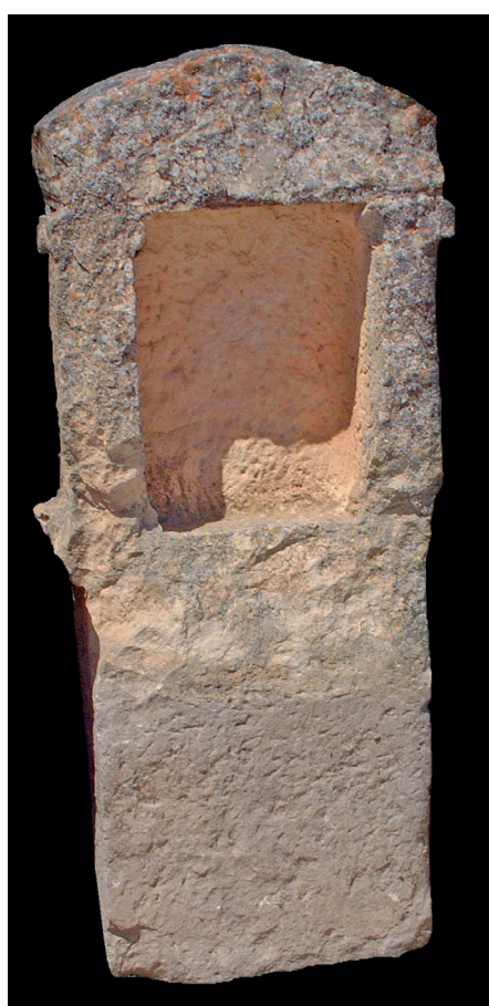
Fig. 2 : naiskos d'Althiburos. (Photo Équipe Althiburos).