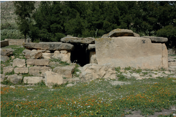
Fig. 9 : monument d'Ellès. (Photo Nabil Kallala).

Mais s'en distinguent peut-être les membres de l'aristocratie enterrés dans les grands monuments mégalithiques, comme à Ellès (Fig. 9) ou à Makthar (Fig. 10), par exemple, ou dans des bazinas comme le monument 242 d' Althiburos 44 , et qui datent bien des derniers siècles du I er millénaire av. J.-C.