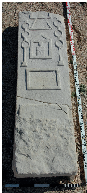
Fig. 13a, b et c. : stèles du tophet d'Althiburos.