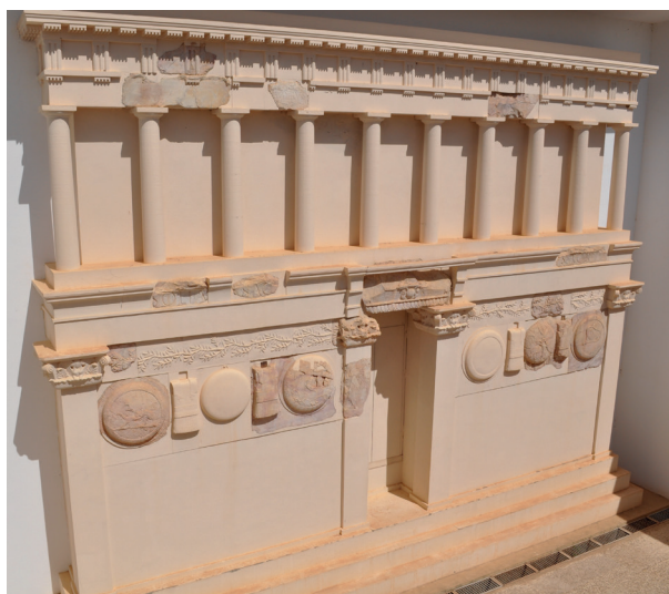
Fig. 14a. : monuments royaux numides : Chimtou.

À considérer l'ensemble de la documentation connue à Althiburos , il appert clairement que la ville a gardé un caractère proprement autochtone, donc foncièrement numide, durant tout le premier millénaire av. J.-C., au moins. C'est ce qu'attestent des indices divers, allant des formes de la céramique de cuisine aux pratiques funéraires et de consommation des aliments, toutes bien différentes de celles que l'on a documentées dans des sites de culture punique. Comment donc expliquer les traits de culture punique reconnus – comme un peu partout en Numidie – à partir du III e et surtout du II e s. av. J.-C. ? D'un point de vue strictement culturel, ces éléments seraient un signe d'« hybridation », mais la question cruciale est de comprendre les raisons de leur adoption, pas seulement de la constater. Le III e s. (sa fin) et surtout le II e s. av. J.-C. constituent le moment où les monarchies numides ont dû affirmer leur pouvoir par rapport aux « nombreux princes » dont parle Appien (livre 10) et dont l'existence est bien attestée par le récit de Polybe (1, 78) concernant Naravas, un aristocrate numide (peut-être Nrwt , « the ancestor of a royal Numidian who governed eastern Libya soon after the destruction of Carthage ») 52 , qui durant la guerre des mercenaires a prêté secours aux Carthaginois.