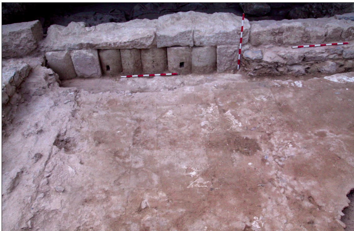
Fig. 3. Cartagena (Carthago Nova). Cimentación de la fachada oeste de la Curia, con reutilización de elementos constructivos y arquitectónicos.

reaprovechados en la construcción del hyposcaenium del teatro de Mérida a finales del siglo I d.C. (Mateos y Rodríguez 2018: 56-58).