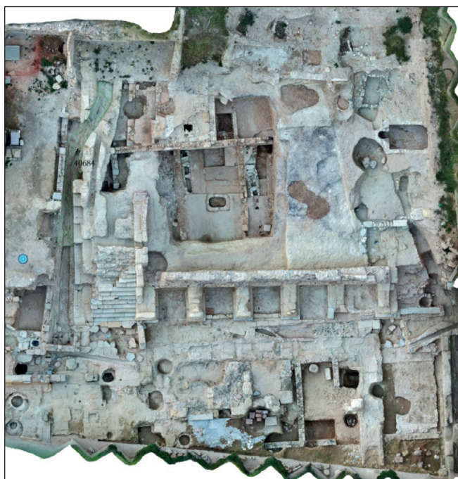
Fig. 1. Cartagena (Carthago Nova). Ortofotografía cenital de las excavaciones del Foro colonial (2017-2019); obsérvese la superposición de las estructuras forenses a un barrio precedente (siglos II-I a.C.).