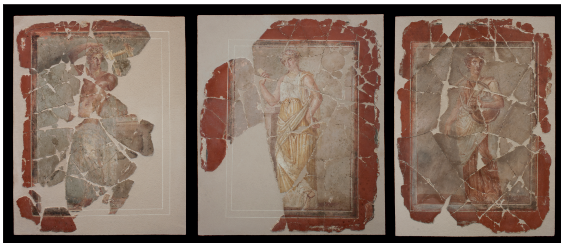
Fig. 5. Cartagena (Carthago Nova). Cuadros con evocaciones de Apolo y las Musas Calíope y Terpsícore, procedentes del Edificio del Atrio.

En este contexto, la denominada habitación 14A (resultante de la compartimentación del aula 14 de época flavia) fue decorada con un programa pictórico del mencionado estilo, aunque el fondo de los paneles y el zócalo no eran blancos sino amarillos. La parte superior era blanca y fue decorada con varios cuadros de tamaño considerable con evocaciones de Apolo y, al menos, las musas Terpsícore, Calíope y Melpómene. Estos cuadros son obra de talleres suritalicos de la segunda mitad del siglo I d.C. (Noguera et alii 2016: 234-235, n.º 9 [I. Bragantini]; Fernández et alii 2018: 655-672), pero fueron extraídos y recolocados en una composición de inicios del siglo III d.C. Esta reutilización cultural y anticuaria demuestra el valor dado al ciclo pictórico y a la estancia que se deseaba decorar con él.