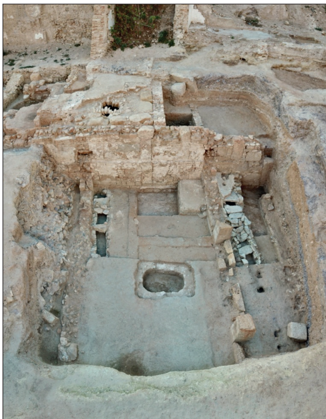
Fig. 2. Cartagena (Carthago Nova). Estructuras domésticas de los siglos II-I a.C., amortizadas y demolidas para la construcción de la fase julio-claudia del Foro colonial.

Respecto a las motivaciones de utilidad, este es posiblemente uno de los ejemplos más tempranos y paradigmáticos constatados hasta ahora en la ciudad, fechándose posiblemente en tiempos de Tiberio. En este caso, el material reutilizado adquiere un valor meramente funcional, haciendo uso de aquellos materiales disponibles, procedentes de la demolición de edificios preexistentes y reutilizables. Este tipo de fenómenos tiene en la propia Cartagena un magnífico exponente tardío en la reutilización de las columnas (basas, tambores de fuste y capiteles) de la scaenae frons del teatro para la construcción del mercado instalado sobre la escena y orchestra del edificio en el siglo V d.C. (Ramallo y Vizcaíno 2011: 225-263), y se conoce bien en edificios más coetáneos de las referidas operaciones en el foro cartagenero, como es el caso de la Porticus Octaviae , construida en Roma hacia el año 27 a.C., en cuyos rellenos constructivos se reutilizaron diferentes elementos arquitectónicos procedentes del pórtico construido por Q. Cecilio Metello (Hansen 2003: 24; Gorrie 2007: 8). Tampoco faltan ejemplos en el solar hispano, donde imperan acciones de utilidad y economía de medios, bien documentadas en los rellenos constructivos del denominado Foro Provincial de Tarraco (Domingo 2009: 802-804) y en el conjunto de sillares y tambores de fuste