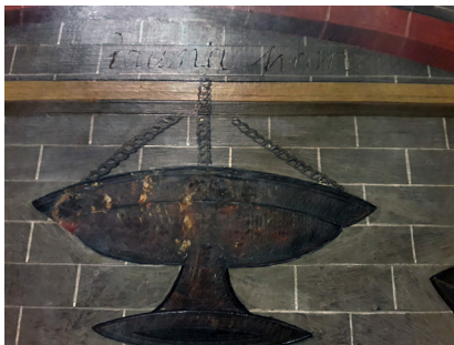
La princesa Eudòxia davant la tomba de Sant Esteve i detall amb la inscripció «Jauma homs».