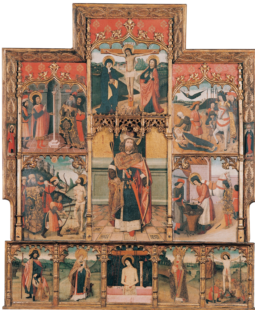
Retaul de sant Sebastià i sant Eloi, que fins al 1879 ocupava una capella lateral de l'església de Sant Esteve de Granollers, i que va ser venut juntament amb el retaul de sant Esteve.

Sancto, segons diuen els textos públics, y algunes de les quals sorprén no trovar en el de Granollers, com també faltan plafons del bancal. 46 Donat el desenvolup de l'absis de l'iglesia parroquial de Granollers, quedaria un retaul migrat, sols amb les pintures existents. Les dels Profetes estaven potser