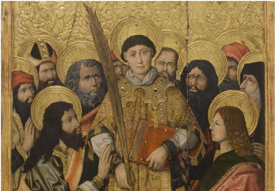
Detall de l'Exaltació de sant Esteve. Els personatges que envolten el sant tenen rostres peculiars, cosa que indueix Rodríguez Codolà a pensar, erròniament, que l'autoria del cap de sant Esteve correspondria a un pintor diferent que la resta de figures.

En la taula de l'Exaltació de Sant Esteve les figures deixen escassament un xic d'espai pera'ls fons de daurat relleu, puig tenen més tamany que les de les demés taules. També aquí hi han tipus de gran caràcter, encare que un mateix model es veu que va servir per diverses imatges. Es d'assenyalar molt sovint una gran perfecció de dibuix. En canvi, sembla fet per un altre pinzell el cap del Sant, inferior a'n el dels demés personatges, descomptant el del de primer terme del de llur esquerra, el més insignificant de tots.