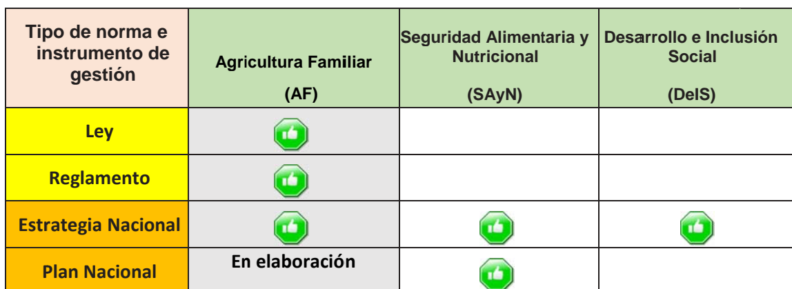
Cuadro 14 Normas e instrumentos de gestión de 3 temas Diciembre 2017

Como puede apreciarse en el cuadro 14, hemos seleccionado 3 temas que cuentan al menos con sus respectivas estrategias nacionales. Sólo uno de ellos cuenta con su respectivo plan nacional (SAyN), del mismo modo dos políticas no cuentan con una ley marco (SAyN y DeIS). Sólo el tema de agricultura familiar (AF) cuenta con Ley, Reglamento y Estrategia, tiene pendiente su respectivo Plan Nacional.