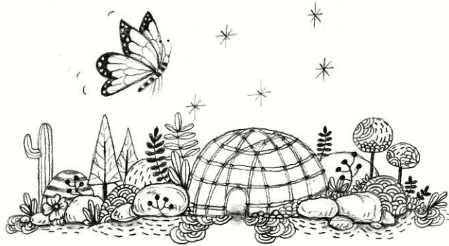
Figura 10. Portada del CD (Anne Decís, 2018)