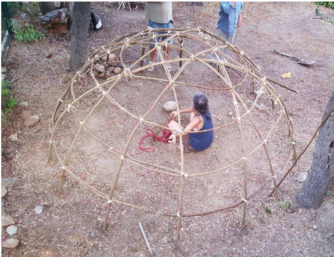
Figura 5: Inipi sense cobrir a la Floresta (Barcelona). Anne Decís, 2017