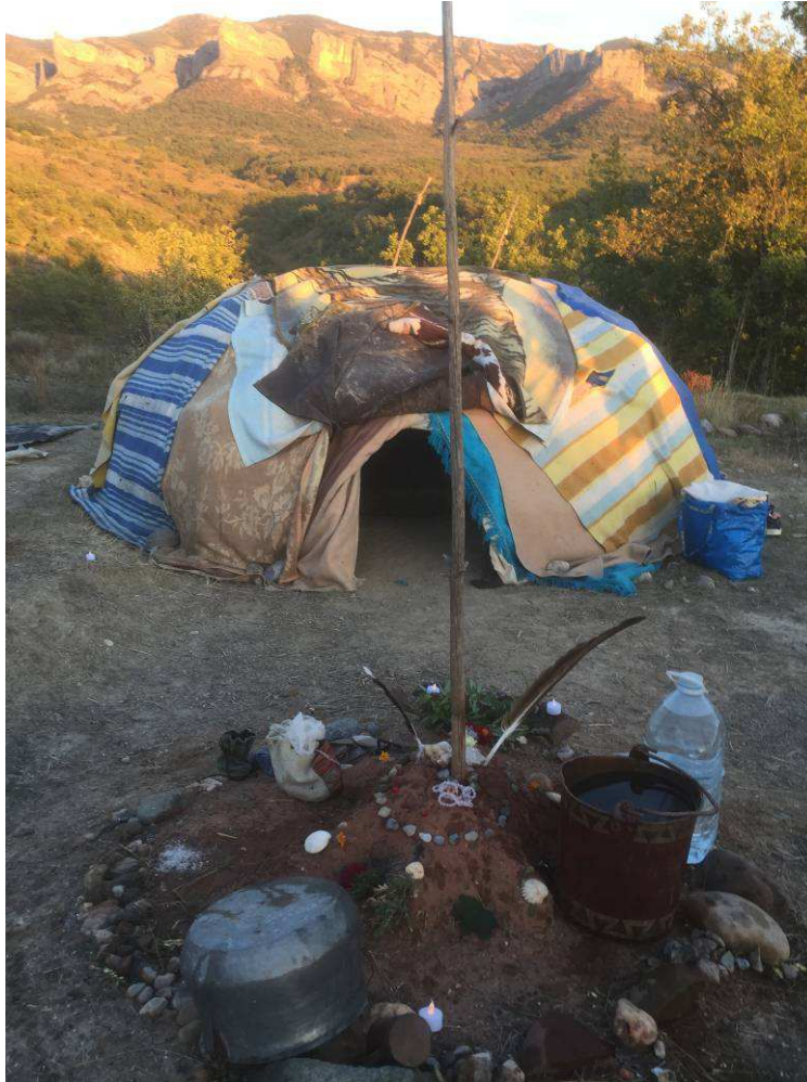
Figura 9. Inipi cobert i altar amb medicines i aigua.

Mentre les pedres agafen la temperatura estem a prop del foc connectant amb el propòsit i de vegades es fa un tabac sagrat per a compartir els propòsits personals. Quan les pedres estan incandescentes ens preparam per entrar (ens quedem en banyador, o amb un vestit). L'home/dona foc col·loca unes brases i cedro (planta que significa neteja) per a que tothom es beneeixi amb el fum que desprèn. Entrem de quatre grapes i en silenci, primer dones i després homes, en el sentit de les agulles del rellotge. A dins normalment es fan dos cercles: un més a prop del forat central on es col·locaran les pedres, allà seuen els que guiaran el temazcal, la dona cedro i els més experimentats ja que rebran més escalfor de les abuelitas . Un altre cercle concèntric just darrera del central. Entren les pedres (simbolisme: fecundació del pare sol a la mare terra) i cantem per rebre-les, la dona cedro col·loca la planta triada pel guia sobre cada pedra i ens beneïm amb l'aroma que desprèn. Un cop totes les pedres són a lloc entra tambor i la sonaja i es tanca la porta. Es canten quatre cants a la primera direcció (l'est, a la infància, a la terra) mentre