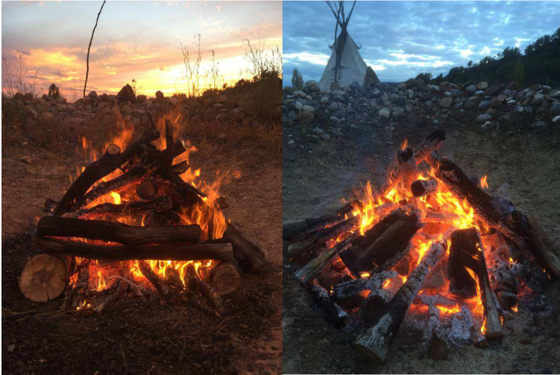
Figura 6. Foc encès on s'aprecia el llit de llenya, dins estàn les abuelitas . Sebastien Puginier, 2017. Figura 7. Foc amb les abuelitas ja calentes i preparades. Sebastien Puginier, 2017