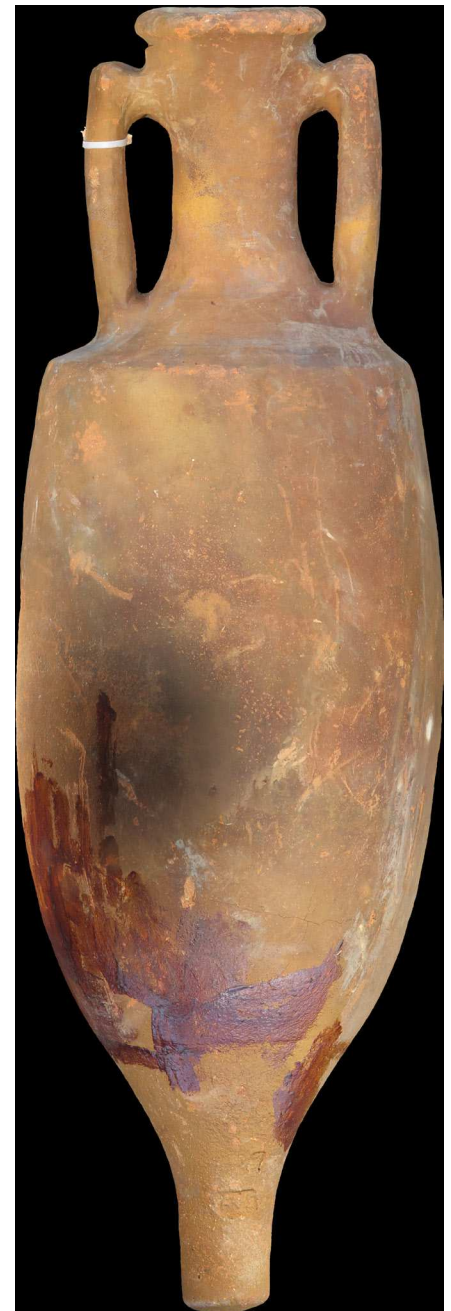
▲ Fig. 1.- Ortoimagen de alta resolución del ánfora extraída a partir de la fotogrametría de la misma

Además, en la zona baja del cuello puede verse un grafito ante cocturam que hemos leído como PRIMI , que podría estar relacionado con la marca PRI que ha sido documentada en la figlina de Sant Vicenç dels Horts, muy cerca de Can Tintorer (Berni y Carreras 2013: 230) o PRIM en el taller de Vila Vella en Sant Boi de Llobregat (López Mullor 1998), aunque pueda tratarse de casos de homonimia. También aparecen inscripciones numerales post cocturam en la parte media del