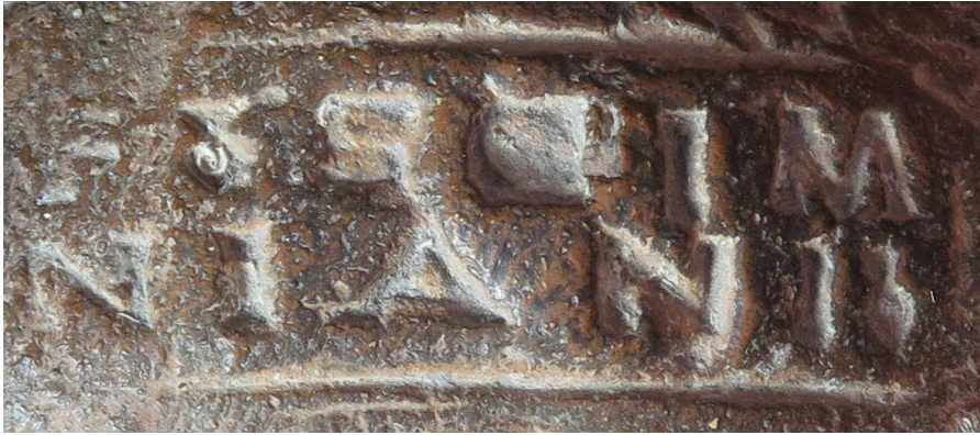
Fig. 3.- Detalle de la marca mejor conservada

bien el cálculo volumétrico que realizó era erróneo.