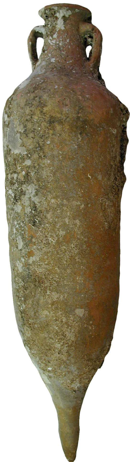
Fig. 2: Fotografía de la pieza.

España se documenta especialmente en Cataluña: Roses, Ampurias, Sant Martí d'Empúries, Torrent de Can Butinyà