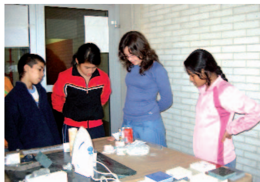
Fig. 2. Reunir los objetos y figuras para la exposición permite a los alumnos, de forma relativamente suscita, centrar y comprender el tema tratado. (foto R. Santó).