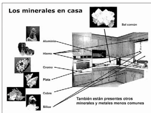
Fig. 4. En los distintos ambientes de casa, especialmente en la cocina y el baño, es fácil localizar muchas materias que se obtienen de los minerales. (PowerPoint: C. Curto).

Se trata de ubicar el tema y la exposición en unas fechas “especiales” determinadas (Semana de los Minerales y las Personas) que sirvan para realzar tanto los resultados obtenidos como el trabajo en sí, y que permitan la visita del conjunto del alumnado, de los profesores del centro y de los familiares de los alumnos.