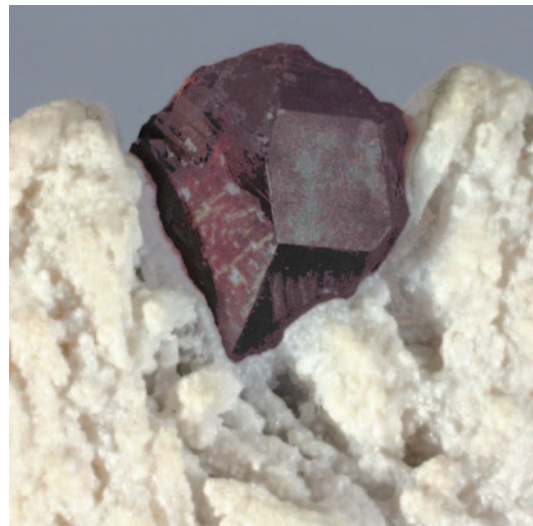
Fig. 5. El coltan, columbita (arriba) más tantalita (abajo), es un mineral básico para la telefonía móvil. (Fotografías: C. Curto).