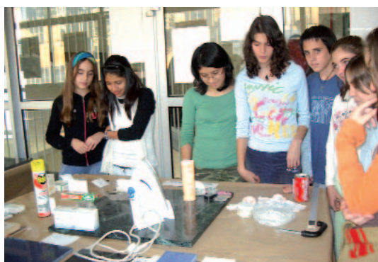
Fig. 1. La exposición ofrece a los alumnos el tema resumido, visual, y ofrece múltiples puntos de reflexión y trabajo tanto al alumnado como al profesor. (foto: R. Santó).

la exposición (taller, aula, laboratorio,...) y determinar sus dimensiones, superficies libres de pared, etc.