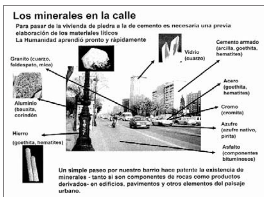
Fig. 3. La calle es un ambiente cotidiano excelente para localizar múltiples usos de los minerales (PowerPoint: C. Curto).

otros centros y circunstancias. La presentación, además de ser un resumen útil de la exposición permite una utilización de largo uso (en clases y años escolares distintos, por ejemplo) y puede servir de fuente e inicio para trabajos más concretos, como los propuestos en este mismo texto sobre temas sociales (coltan, niños mineros, el oro en Rosia Montana, etc.) para los que se puede utilizar bibliografía concreta, ya sean libros o revistas de divulgación (Bariand et al. , 1978; Curto y Vidal, 2003, 2004, 2005, 2006, 2007 y 2008; Dud'a y Rejl, 1988; Pons, 1975) o información web. (Fig. 3 y 4)