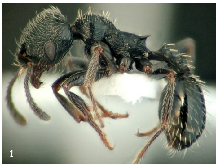
Fig. 1. - Obreira de Goniomma hispanicum , vista lateral.

Wagner, H.C.; Arthofer, W.; Seifert, B.; Muster, C.; Steiner, F.M. & Schlick-Steiner, B.C. 2017. Light at the end of the tunnel: Integrative taxonomy delimits cryptic species in the Tetramorium caespitum complex. Myrmecological News , 25 : 95-129.