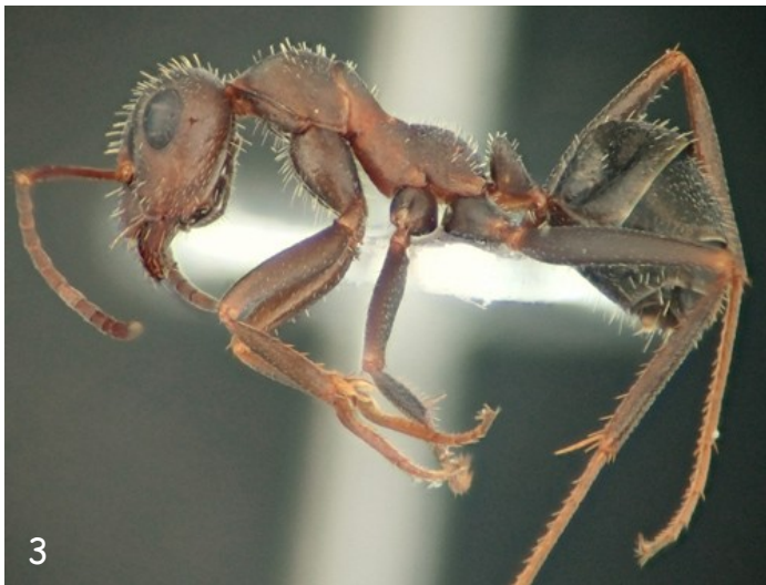
Fig. 3.- Obreira de Iberofornica subrufa , vista lateral.