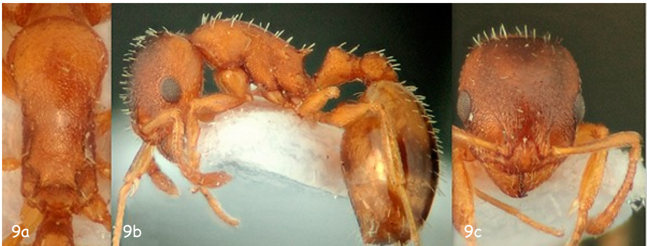
Fig. 8.- Obreira de Stenamma debile . a.- Mesosoma, vista dorsal. b.- Habitus, vista lateral. c.- Cabeza, vista frontal.