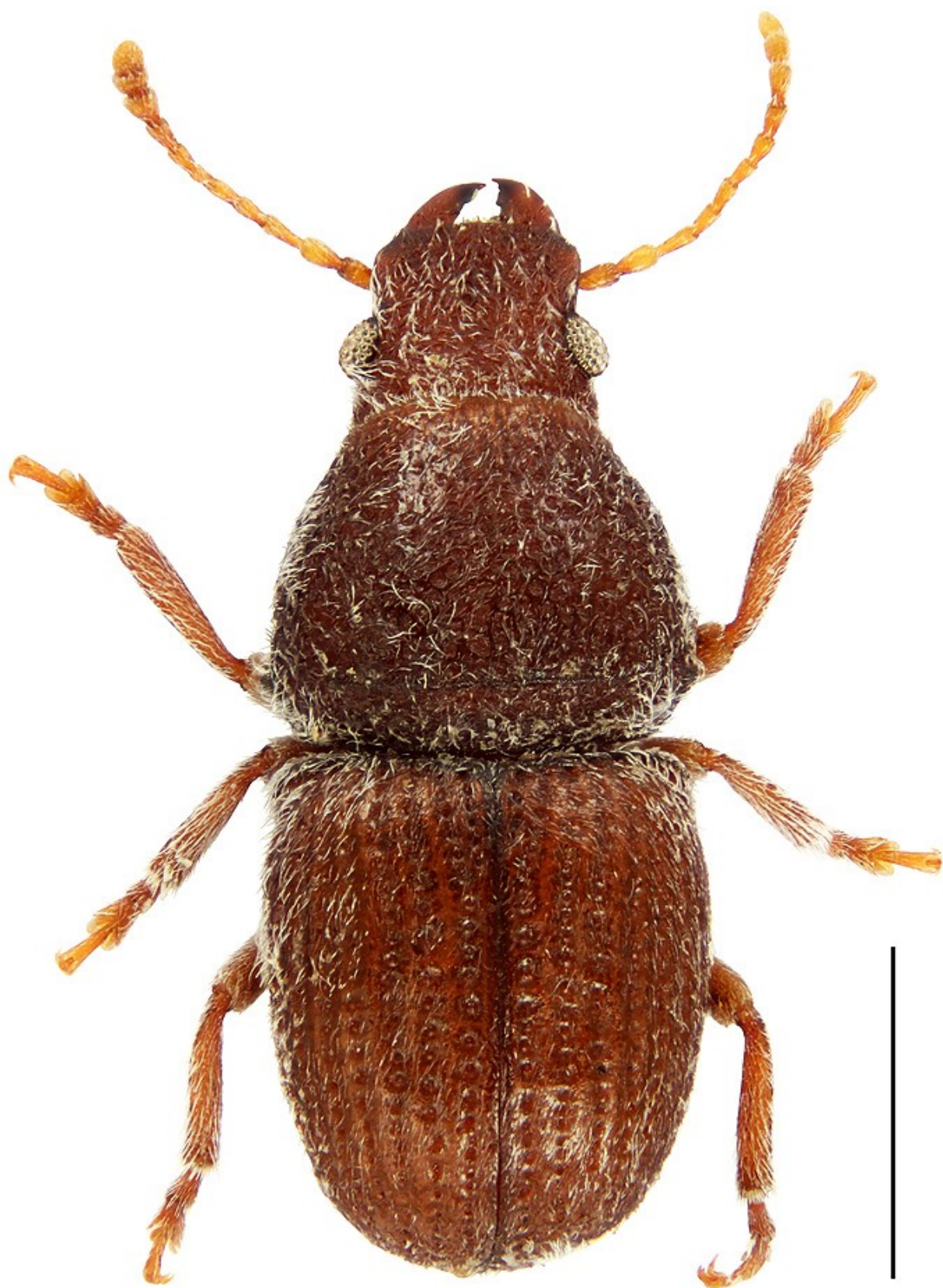
Fig. 1. - Habitus de la hembra del Anthribidae Phaenotheriolum espanoli González, 1969 de Andilla, Valencia. Escala = 1 mm.