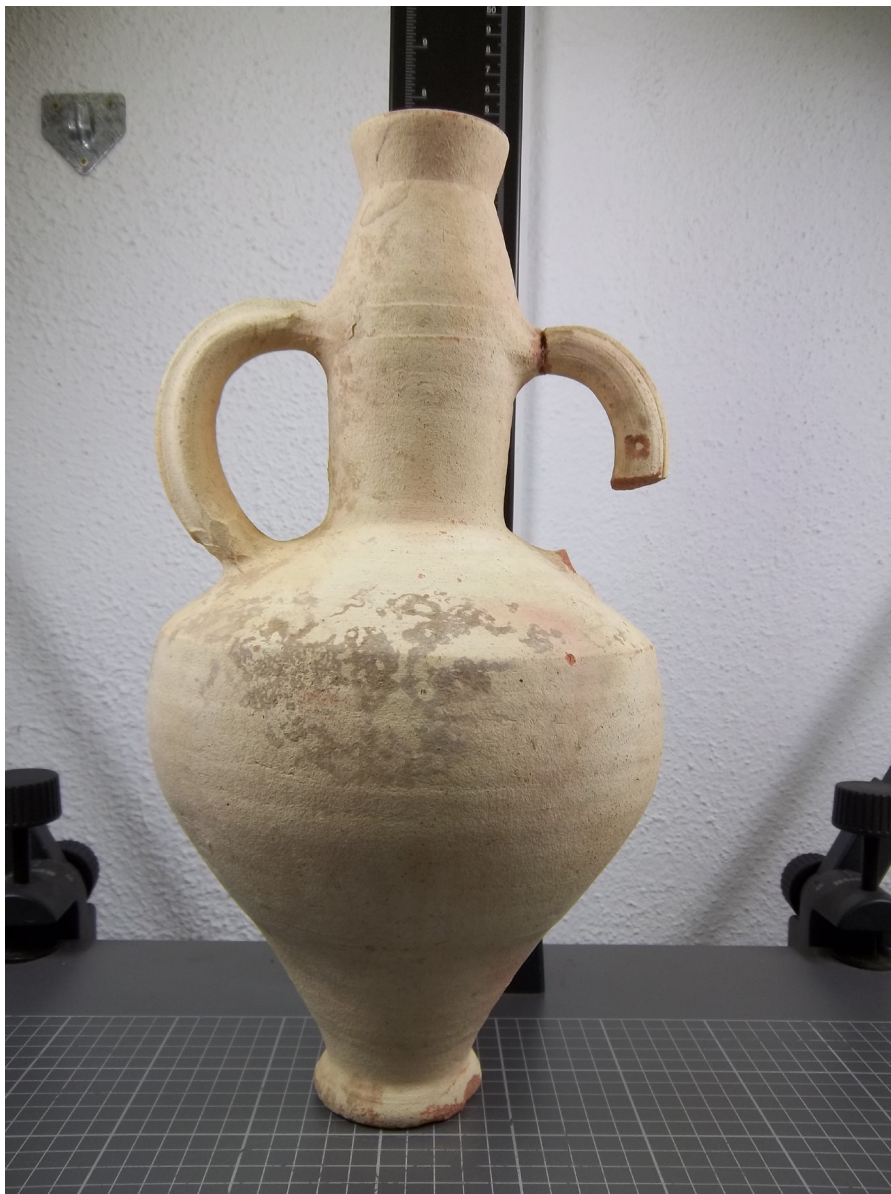
Fig. 3. Fotografía del ánfora estudiada.

AAVV 2009: "Objects du commerce et du quotidien", en L. Long y P. Picard (eds.): César. Le Rhône pour mémoire , Arles, 246-273.