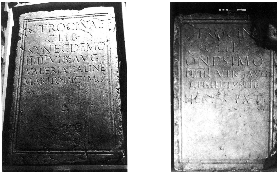
FIGURA 72. Vista dels dos pedestals privats: Synecdemus i Onesimus .

Tornem a la inscripció de Synecdemus : el pedestal va ser-li dedicat per la seva esposa, Valeria Haline , una lliberta d'una família documentada abundantment a la ciutat. De l'absència de la fórmula oficial per a la concessió del lloc honorífic per part del senat local es pot deduir que, en principi, el pedestal estava destinat a un context privat. 22 En això concorda el seu lloc de trobada a prop del castell de Castelldefels —sens dubte extraurbà—, procedent amb molta probabilitat d'un fundus proper (IRC, IV, núm. 198). La motllura, com hem comentat, és molt semblant a la de l'exemplar dedicat a Onesimus per Philetus , el seu heres , i, com en el cas que ens ocupa, també mancat de la fórmula oficial i, per tant, destinat a un àmbit privat (figura 72). Aquest detall es manifesta molt il·lustratiu en contrast amb el segon pedestal dedicat també a Onesimus , aquest, però, posat al seu torn per l'hereu de Philetus , Paramythius , i, al contrari del primer, amb una destinació pública, com explícitament assenyala la indicació de la fórmula l(ocus) d(atus) d(ecreto) D(ecurionum) . També destaca el tipus de motllura, que, tot i que presenta la forma habitual de