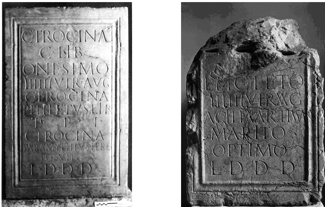
FIGURA 73. Vista dels dos pedestals públics: Onesimus i Epictetus .

En conseqüència, a la vista dels tipus epigràfics (paleografia, ordinatio i motllura) és possible proposar una mena de «subtipologies» diverses per als pedestals dels sevirs augustals dels Pedanii i els Trocinae : la primera té una motllura qualificable de més senzilla, amb disposició del text a la part superior del camp epigràfic, amb absència de fórmula oficial, i era destinada a l'àmbit privat; la segona, amb el text complet distribuït per tota