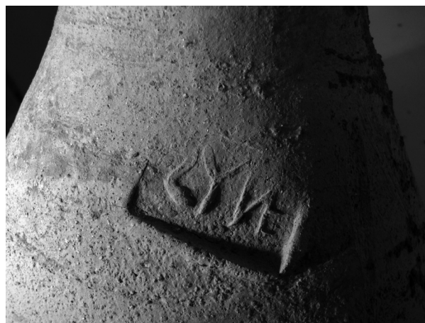
FIGURA 69. Segells sobre àmfors Dressel 2-4 procedents de Sant Vicenç dels Horts ( corpus , núm. 109 a9 i d1).

La forma SYNE sembla, respecte a SYN, una subtil variant formal —NE en nexa— no discriminant cronològicament, tal com confirmen les àmfors en les quals es troba, que no presenten tampoc cap diferència que pugui indicar una evolució formal en el tipus Dressel 2-4. 6 Això confirma, per una banda, la contemporaneïtat de les marques, mentre que, a la vegada, impossibilita la proposta de reconèixer dos personatges diversos darrere d'aquesta marca treballant a la vegada dins d'una mateixa officina , ja que s'anul·laria l'element fonamental d'identificació dels diversos responsables d'una activitat comercial com és la producció d'envasos per a la comercialització del vi.