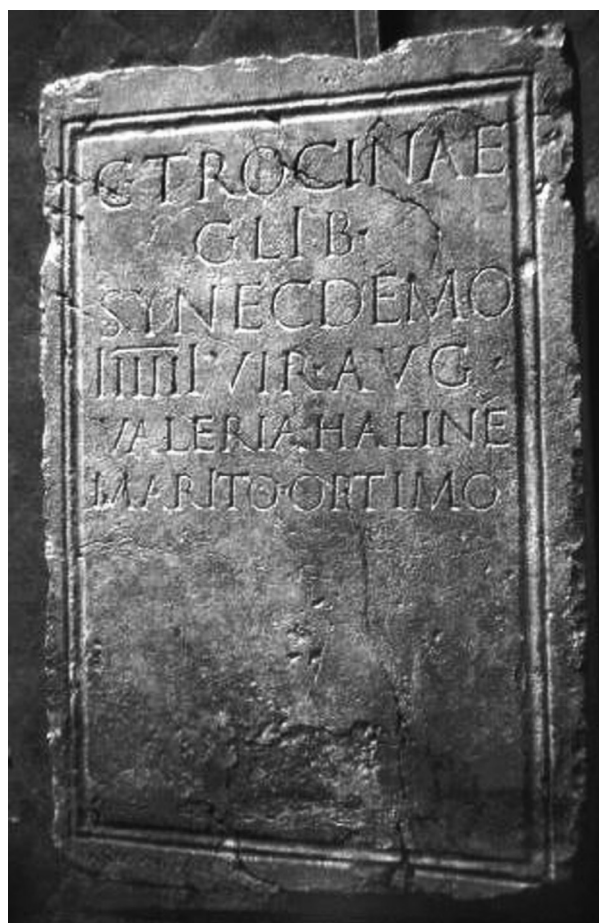
FIGURA 70. IRC, IV, núm. 112: C(aio) · Trocinae / C(aii) · lib(erto) · / Synecedemo / IIIIIvir(o) · Aug(ustali) · / Valeria · Haliné / marito optimo.

En conseqüència, pensem que el responsable de la terrisseria amb les marques SYN/SYNE va ser