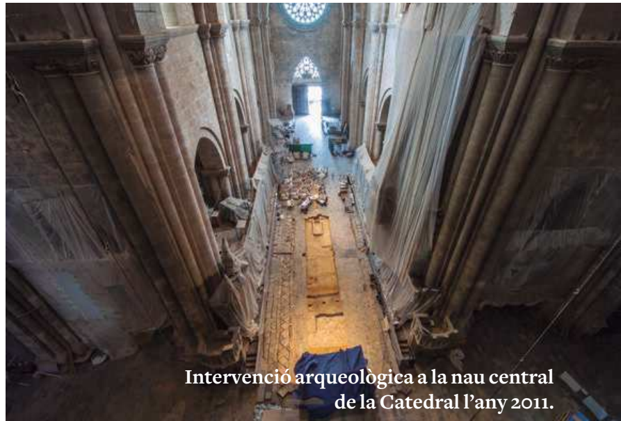
Intervenció arqueològica a la nau central de la Catedral l'any 2011.

També, el 23 de novembre de 2009 una nova iniciativa es projectava amb els treballs arqueològics