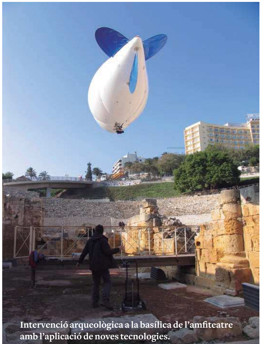
Intervenció arqueològica a la basílica de l'amfiteatre amb l'aplicació de noves tecnologies.

En aquests últims anys més de 30 publicacions en llibres i revistes especialitzades han permès transferir tot aquest coneixement a la societat a nivell mundial. La nostra Església de Tarragona també forma part de manera permanent en la comissió científica dels congressos internacionals d'arqueologia organitzats des de la Tarraco Biennal. Cal també anotar que des de fa més de 20 anys, a través de l'Institut Superior de