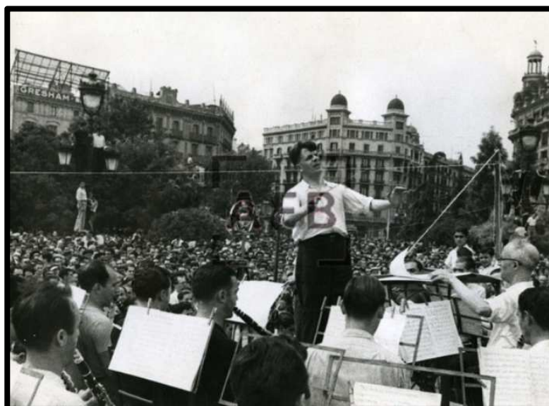
Imatge 4. Eduard Toldrà dirigint la banda de Milícies Antifeixistes de Barcelona a la Plaça Catalunya el 30 d'agost de 1936.