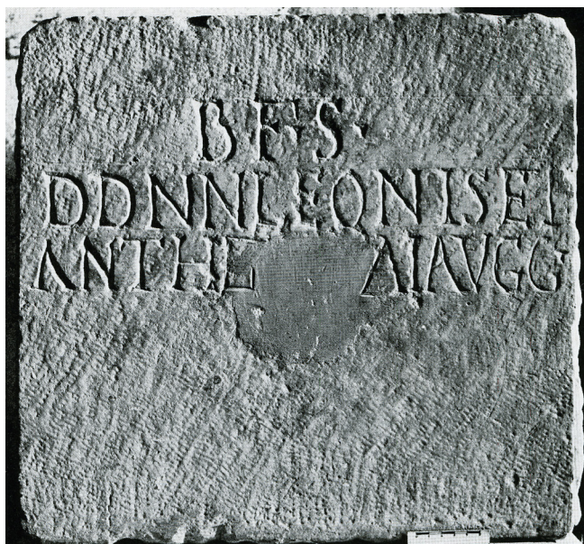
Fig. 3. Inscripción dedicatoria a los emperadores León I y Antemio (RIT 100 = CIL II 2 /14 947).

Para esta fase inicial de transformación no se constata la construcción de nuevos edificios ni tampoco una alteración arquitectónica o urbanística significativa de los viejos recintos altoimperiales. Ello nos lleva a pensar que, al menos durante mediados del siglo V, se mantuvo la titularidad y el uso público de estos espacios, aunque adaptado a las necesidades de una realidad de poder muy distinta a la del siglo I. Una apreciación que se ve reforzada por el hallazgo del pedestal de una estatua en honor de los emperadores Leo I y Anthemius erigida en el foro provincial (Pérez, 2014) (Fig. 3). El expolio de la decoración arquitectónica y la formación de vertederos domésticos en el interior de estos espacios públicos no pueden ocultar – más allá de una valoración estrictamente estética – una decidida voluntad y capacidad para afrontar la transformación urbanística de un sector tan extenso y preeminente de la ciudad.