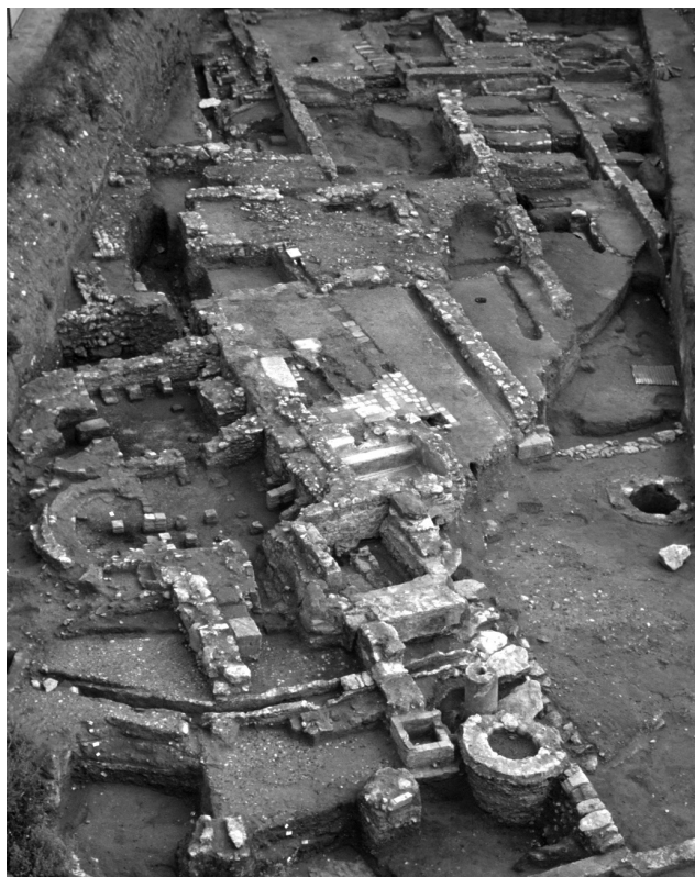
Fig. 5. Uno de los balnea tardíos localizados en el sector occidental del suburbio portuario.

En el otro extremo de la ciudad romana, en torno a las vías de acceso desde el noreste, no se detectan indicios claros de ocupación a partir de finales del siglo III. Hasta ese momento se había desarrollado un suburbio, poco denso y más disperso, del que se conocen diversos tramos viarios, monumentos funerarios y domus suburbanas (Remolà, 2004). El anfiteatro, se mantuvo aparentemente en uso. Las fossae de la arena de este edificio, el más destacado de este sector, se amortizan en la primera mitad del siglo V, lo que no supone, necesariamente, la pérdida de su función pública y lúdica (TED'A, 1990).