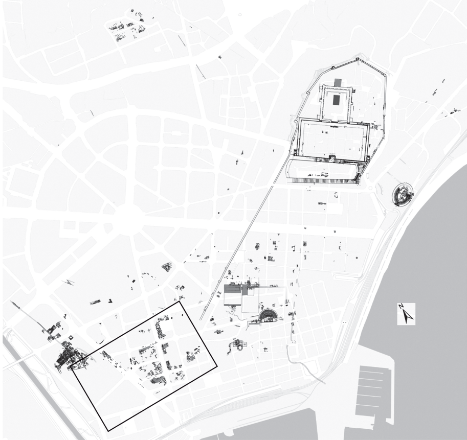
Fig. 2. Planta arqueológica Tarraco . El recuadro se corresponde con el área de la figura 4 (composición propia a partir de Macias et al. 2007).

señalar, contrasta claramente con la situación anterior 17 . A mediados del siglo V corresponden los primeros indicios de transformación en la cima de la colina tarraconense, ocupada, a partir del siglo I d.C., por el recinto del templo de Augusto, una gran plaza de representación y el circo, un conjunto monumental vinculado con la sede del concilium provincial (TED'A, 1989; Macias, 1999; Remolà, 2000).