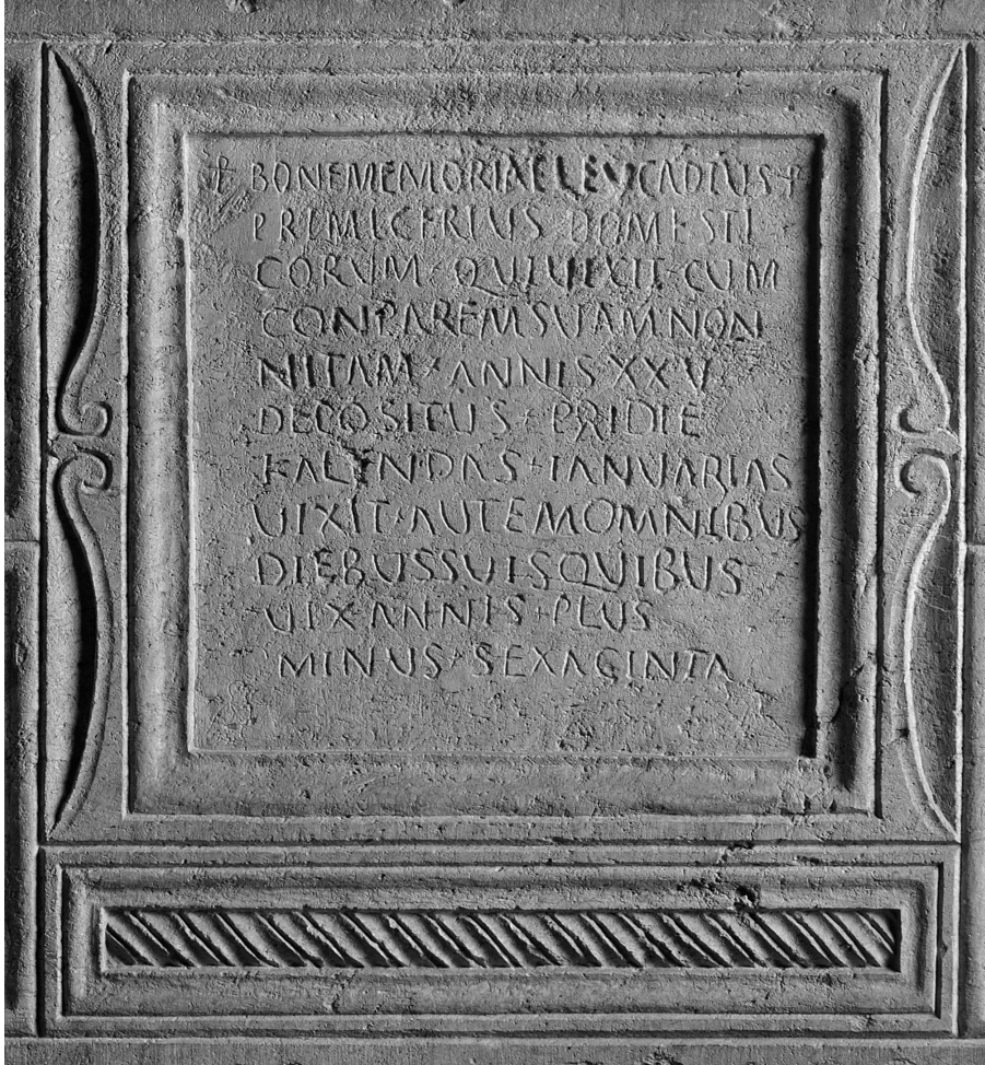
Fig. 6. Detalle de la inscripción del sarcófago del primicerius domesticorum Leocadio (MNAT P-42).