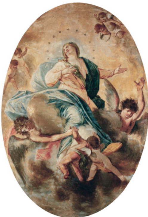
Figura 6. Assumpció de la Mare de Déu , MNAC/MAC 202179.