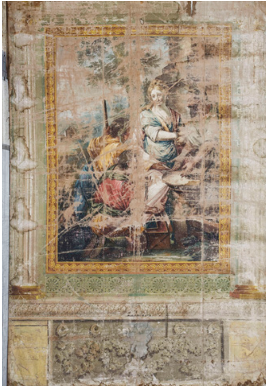
Figura 3. Abraham i els àngels , MNAC/MAC 68749.

Agustí Duran i Sanpere, apareix una llista de les obres: les onze ciutats amb la història de Roma, cinc teles de l'anomenada Sala Bíblica i set teles més de l'anomenada Sala dels paisatges. D'una banda, el conjunt de cinc pintures de la Sala Bíblica faria referència a les cinc històries de l'Antic Testament, dedicades a Abraham i Tobies (fig. 3) i atribuïbles al Vigatà. La sèrie estaria formada per Abraham i els àngels (MNAC/MAC 68749), Abraham foragita Agar i el seu fill (MNAC/MAC 68750), Àngels entre núvols sostenint les taules de la llei al costat de la Mare de Déu —sostre— (MNAC/MAC 68748), Tobies presenta la seva esposa als seus pares (MNAC/MAC 68751), Curació de la ceguesa del pare de Tobies (MNAC/MAC 68752).