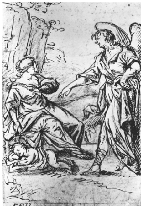
Figura 8. Agar, Ismael i l'àngel , MNAC/GDG 27210-D.

Per acabar, també farem una llista dels dibuixos del Vigatà que es conserven al Museu Nacional d'Art de Catalunya. En concret, són nou dibuixos, tots procedents de l'antiga col·lecció de Raimon Casellas, comprats el 1911 a la seva vídua, pocs mesos després de la mort del crític d'art. La majoria són coneguts per la historiografia, excepte dos que són inèdits i poc de l'estil del Vigatà: Estudi per a una decoració de Tobies i l'àngel (MNAC/GDG 4173-D) i Composició al·legòrica (MNAC/GDG 4175-D). Dos més, relacionats amb la història de Tobies, s'han concebut com a preliminars per a la decoració de la Casa Roca, anteriorment esmentada, Tobies i l'àngel (MNAC/GDG 27211-D) i Benedicció de Tobit al seu fill Tobies (MNAC/GDG 27212-D), i per tant s'haurien de datar entre el 1780 i el 1784. Un altre amb Agar, Ismael i l'àngel (MNAC/GDG 27210-D), datat cap a 1775 (fig. 8). I, finalment, tres de relacionats amb cossos d'infants: Cupido (MNAC/GDG 27213-D), Angelets (MNAC/GDG 27214-D) i Angelet (MNAC/GDG 27215-D), tots datats cap a 1775. 43