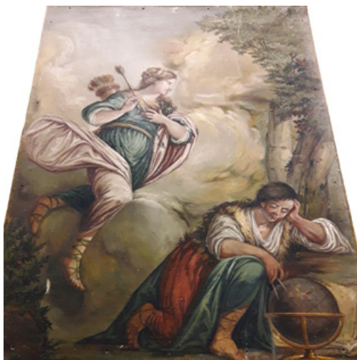
Figura 7. Diana i la musa Urània , MNAC/MAC 8385.