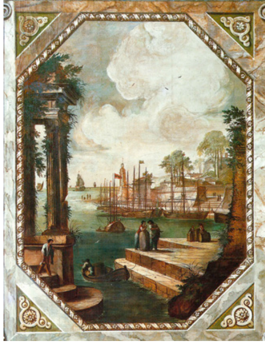
Fig. 4. Paisatge amb port i velers, MNAC/MAC 68745.