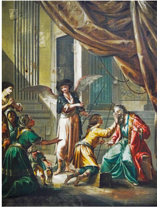
Figura 5. L'arcàngel sant Rafel cobra de Gabel els diners que devia al pare de Tobies , MNAC/MAC 43882.

don Pedro y don Esteban Bach Escofet». 33 La sèrie està formada per nou teles (fig. 5): Tòbies rep la benedicció del seu pare (MNAC/MAC 43875), Tòbies, l'arcàngel Rafel i el gos arriben al riu on s'ha de rentar els peus (MNAC/MAC 43876), Tòbies es renta els peus (MNAC/MAC 43877), Tòbies agafa un peix del riu (MNAC/MAC 43878), Tòbies ensenya les entranyes d'un peix a l'arcàngel sant Rafel (MNAC/MAC 43879), L'arcàngel sant Rafel ensenya a Tòbies la casa de Ragüel (MNAC/MAC 43880), Tòbies arriba a la casa de Ragüel , Tòbies cura la ceguesa al seu pare (MNAC/MAC 43881), L'arcàngel sant Rafel cobra de Gabel els diners que devia al pare de Tobies (MNAC/MAC 43882).