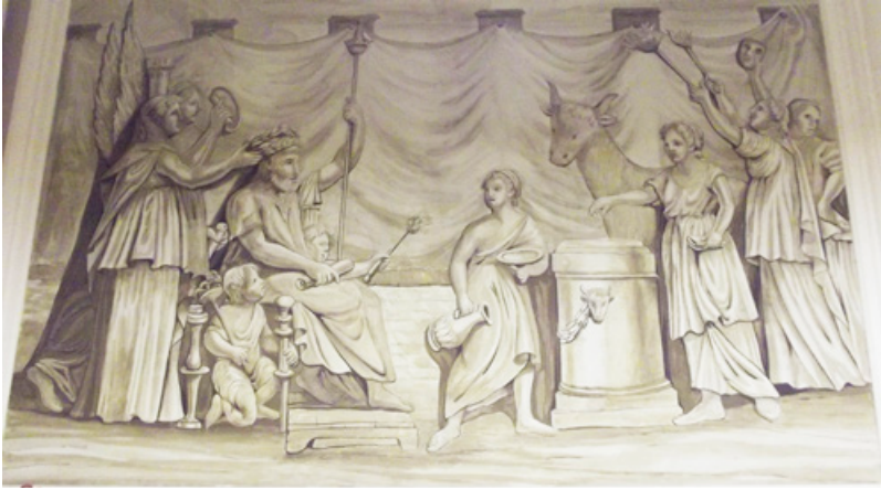
Figura. 1. Pintura de l'antic palau del marquès de Capmany a la vila de Cervera.

cora la façana de la Paeria de Cervera amb motiu de la família reial. 9 Amb tot, però, l'estil del pintor recorda les obres juvenils de Pau Rigalt i Fargas (Barcelona, 1778-1845), com ara l'obra Venus i Adonis (?), feta cap al 1799 i conservada al Museu Nacional d'Art de Catalunya (MNAC/MAM 40714); i també en grisalla trobem algunes de les seves obres més conegudes, a Can Llopis (Sitges) o Can Cabanyes (Vilanova i la Geltrú). 10 L'activitat d'un jove pintor de 23 anys s'hauria de contextualitzar en les circumstàncies de la vinguda dels monarques l'any 1802 i l'allau decorativa que hi havia a Barcelona, és a dir, que faltaven mans per poder dur a terme tantes obres.