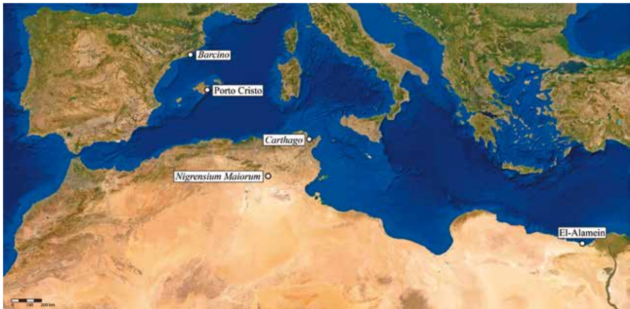
FIG. 1. Lugares donde se han documentado marcas epigráficas en instrumentum domesticum relacionadas con los Minicii Natales, así como su ciudad de origen.

N(onius) L(aetus), M(arcus) N(aevius) L(onginus) etc., o N·L·M –bastante improbable, pues el praenomen debería ser Numerius , que era absolutamente minoritario–. Por ello, creemos que la lectura más fiable es L·M·N , leída en sentido contrario al de las agujas del reloj, tal y como ya propuso en su momento Freed (1998: 353), máxime teniendo en cuenta la existencia de otra variante de esta marca. Nos referimos a la estampilla LMNO , en este caso sin interpunciones aunque también aparece en cartela circular, en el llamado “segundo muro de ánforas de Carthago ” (Delattre, 1906: 43, n.º 18; Freed, 1998: 355, fig. 2, n.º 8), en la cual creemos que la letra ‘o’ puede desarrollarse como officina . Además, Lucius es el praenomen más corriente en Hispania (Abascal, 1994: 28). Cabe destacar que, años antes, esta marca fue publicada por Pascual (1991: 90, n.º 140) como MNOL , si bien pensamos que la lectura que hizo es incorrecta.