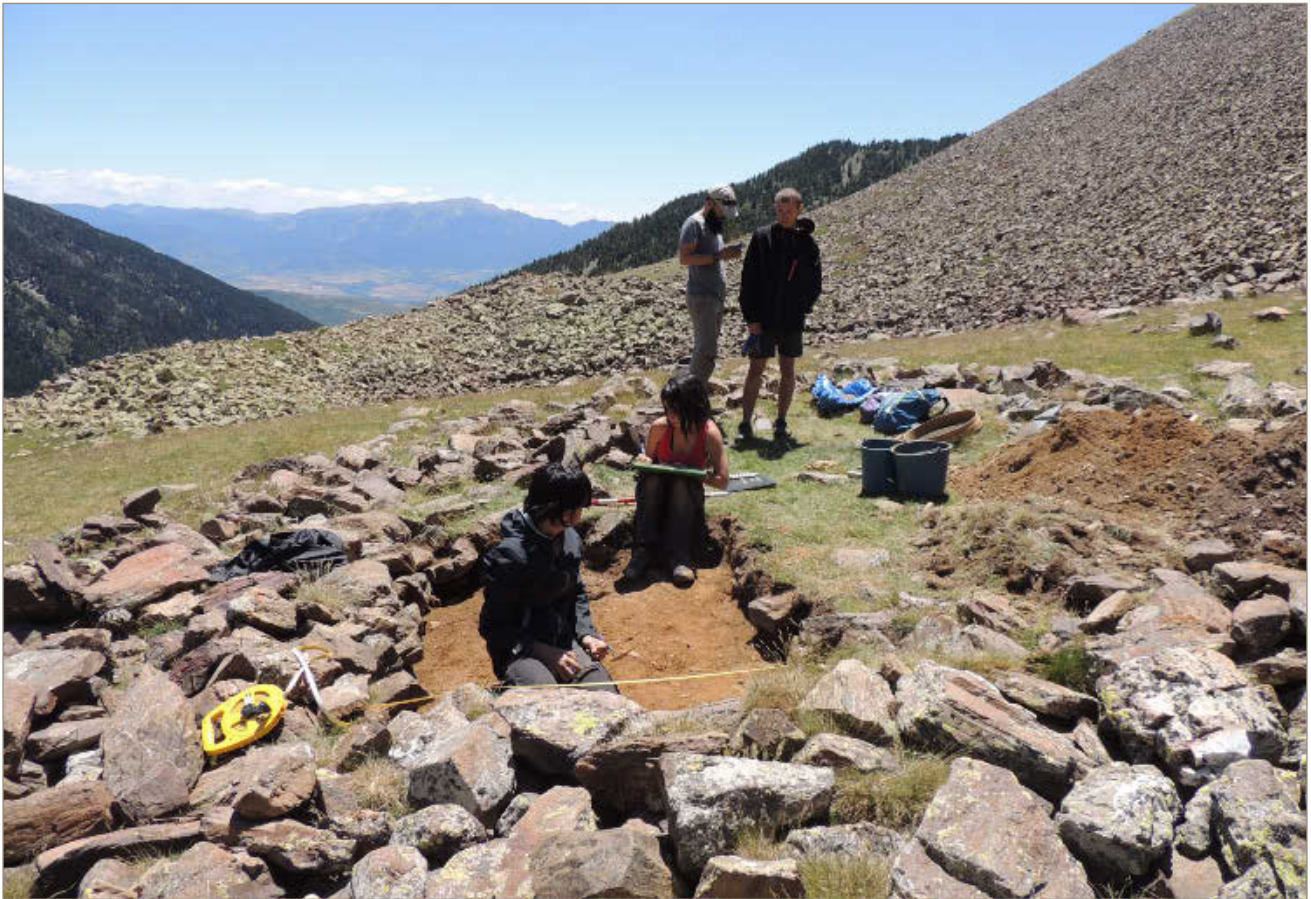
Figura 2. Treballs arqueològics a l'estructura 023 al jaciment de Duran I (Meranges).

permeten obtenir material orgànic en situacions estratigràfiques fiables per a la realització de datacions absolutes i sediment, tant per estrat com talls continus, per la realització d'anàlisis paleobotàniques i pedològiques en les estructures sondejades.