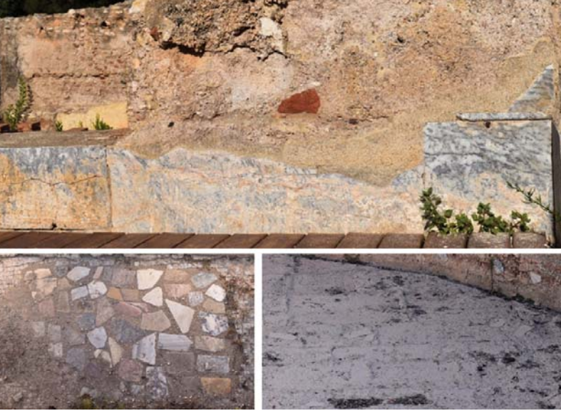
Figura 3 Plaques de marmor in situ a la zona dels "banys inferiors" dels Munts (a dalt), plaques reaprofitades per a un aplacat tardoantic i empremtes de plaques a la piscina del frigidarium (a baix, a l'esquerra i a la dreta, respectivament)

dels Munts 25 . A més, la descripció d'unes termes del segle II dC feta per l'escriptor grec Llucià de Samòsata en la seva obra Hippias , 26 en la qual esmenta materials i estances termals que coincideixen en bona part amb el que trobem aquí, reforça encara més les hipòtesis anteriors. Tot això, doncs, ens permet adscriure la majoria dels revestiments marmoris 27 al mateix moment de construcció de la gran vil·la residencial construïda a inicis del segle II dC.