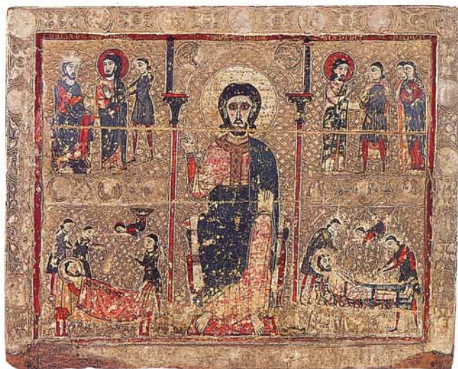
Fig. 2. Frontal de Sant Vicenç de Tresserra (MLDC).