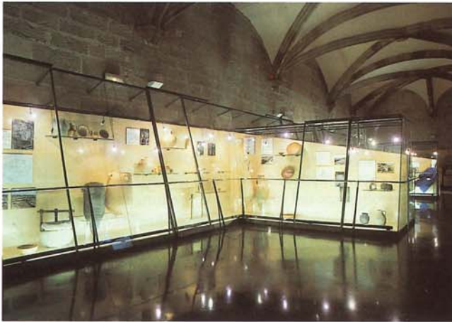
Fig. 3. Detall de la Sala d'Arqueologia de l'IEI.

joc d'escacs de cristall de roca procedent de la col·legiata d'Àger), la col·lecció romànica destaca no tant per la seua quantitat sinó per la seua qualitat: posseeix un grup de frontals romànics on cadascun dels quals és representatiu d'una tipologia i d'una tècnica concreta.