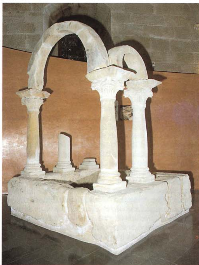
Fig. 4. Imatge del Baptisteri de Bobalà , exposat actualment a la Sala d'Arqueologia de l'IEI.

L'època gòtica disposa de testimonis rellevants amb els fragments de l'escultura funerària procedents del convent Trinitari d'Avinganya. 11 La importància d'aquests fragments —que pertanyen als sepulcres de la família Montcada— radica tant en el seu valor artístic com en el seu parentiu estilístic amb obres de la Seu Vella procedents de conjunts de la mateixa nissaga —els sepulcres de la capella de Sant Pere o de Montcada—. La incorporació d'aquestes