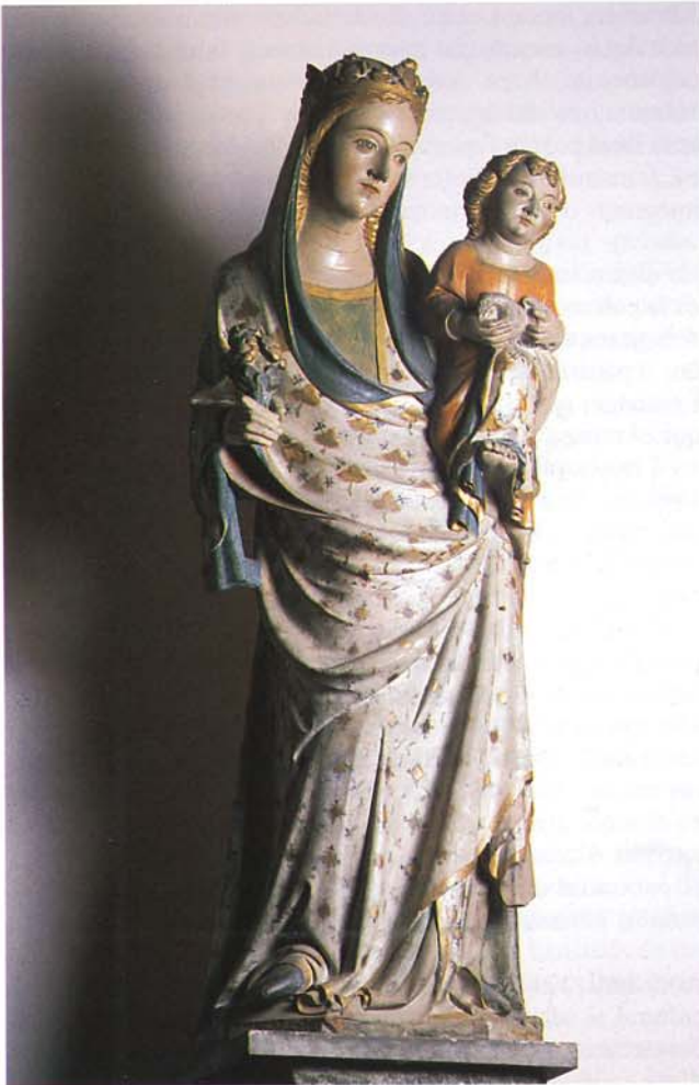
Fig. 5. Imatge de la Mare de Déu de Saidí , ubicada a l'església de Sant Llorenç (MLDC).

voluntat de poder oferir una lectura global, integradora i, alhora, contextualitzadora de les manifestacions artístiques i històriques de la zona d'abast del museu. En aquest sentit, el museu es complementa amb les següents extensions: