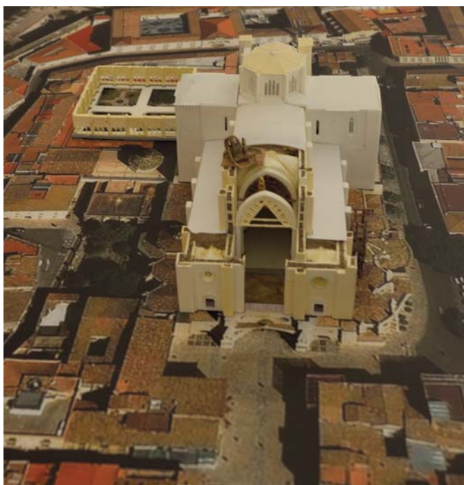
Detall de la maqueta de la catedral medieval sobre fotografia aèria de l'acròpolis de Tarragona

figura del bisbe de Vic, Berenguer Sunifred de Lluçà, però la presa de la ciutat no es produí fins al segle XII, per impuls de l'arquebisbe Oleguer i l'acció militar del cavaller Robert d'Aguiló. L'arquebisbe Bernat Tort, a mitjan segle XII, fixà la seva residència a Tarragona i va ser determinant en la planificació de l'urbanisme de la ciutat medieval.