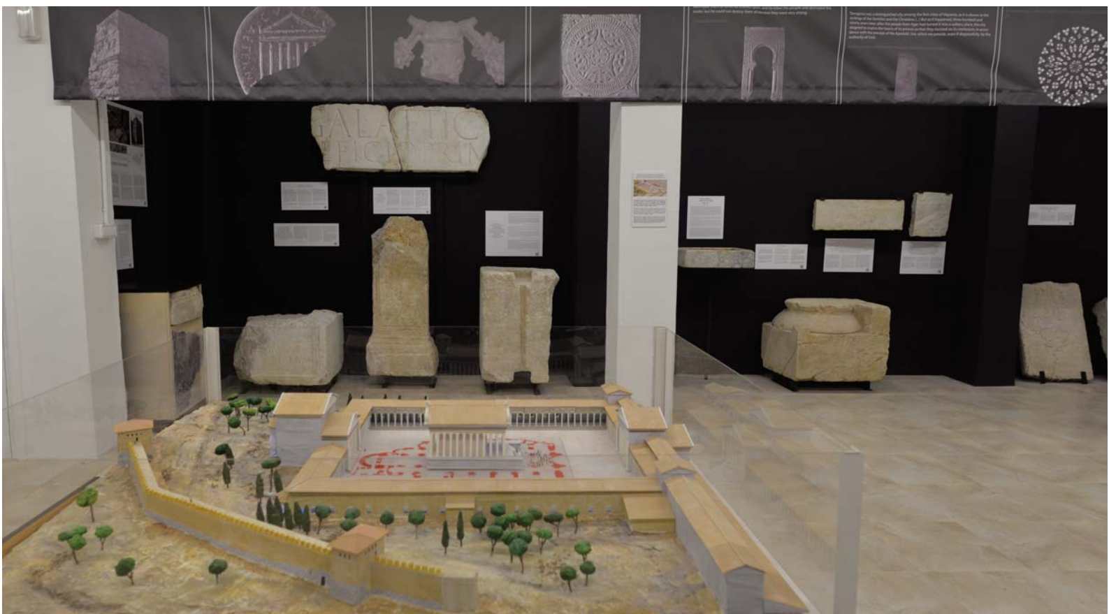
Detall de l'espai Tarracròpolis amb part de la secció epigràfica i la maqueta del recinte sagrat en primer terme