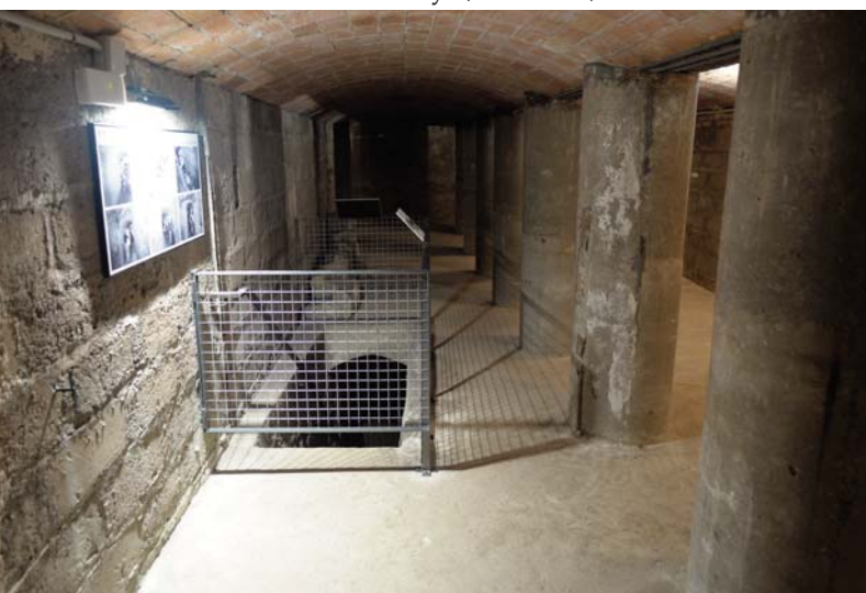
Vista del subsol de cisternes amb accés al refugi excavat dins la muntanya

que s'utilitzaven en catedrals i esglésies per pagar als canonges l'assistència al cor i a altres serveis però que, traspasat l'àmbit eclesiàstic, s'usaven com a moneda local. Els anys 1611 i 1646 Tarragona fou concessionària per batre ardots i diners però es desconeix l'existència d'exemplars. El circuit monetari en època moderna es caracteritzà per la presència de moneda castellana, sobretot a partir de la Guerra de Successió, quan els guanyadors imposaren l'obligatorietat de circulació pel Principat del monetari castellà i, entre altres, el tancament de la seca de Barcelona. Tot i així, el poble continuà utilitzant les antigues monedes catalanes i les de poc valor, moltes d'elles ressegellades, fins que Isabel II va obligar a retirar-les l'any 1854.