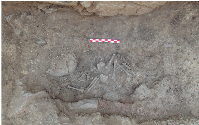
Fig. 3. Inhumació infantil E-28 de l'illa d'en Reixac d'Ullastret, probablement dins d'una urna de ceràmica.