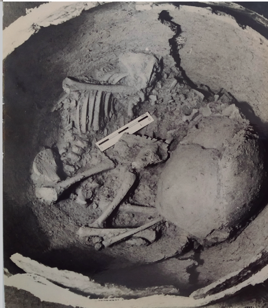
Fig. 5. Foto d'una inhumació en gerra al jaciment del Castellet de Bernabé, Olocau.