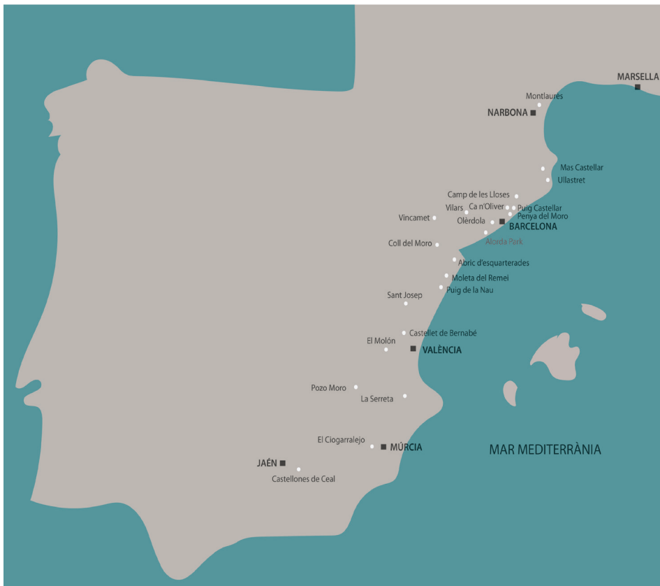
Fig. 1. Situació dels jaciments esmentats en el text (marcats amb cercles), així com les principals ciutats actuals (amb quadrats). M. C. Belarte.