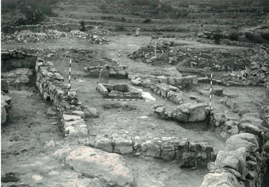
Fig. 6. Vista de l'edifici H-2 de La Escudilla (Sucaina), probablement de caràcter cultural, excavat per Francesc Gusi. Diputació de Castelló.

infantils estan dipositades dins d'urnes, algunes amb un sol infant, però la majoria en contenen dos o més. En algunes de les urnes hi ha restes de fauna que acompanyen els infants i, més rarament, objectes arqueològics. Un altre exemple és el tall LL-1 del Puig de Sant Andreu d'Ullastret (segles IV-III aC), amb diverses inhumacions d'infant i d'ovicaprins dins fosses cobertes amb pedres i toves, al voltant d'un basament quadrangular.