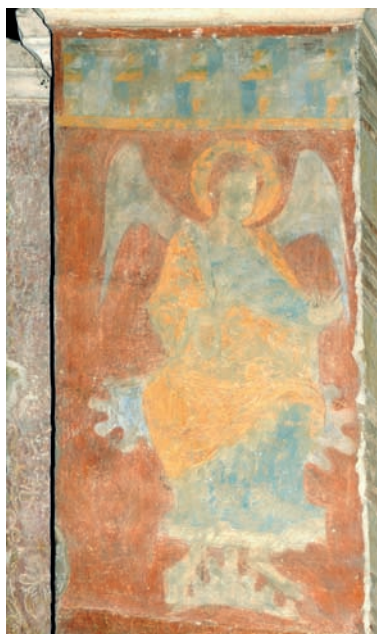
Fig. 3. Toulouse, Saint-Sernin, colateral nord de la nau, segon tram est, pilar est, cara oest, àngel (foto AMH) / Toulouse, Saint-Sernin, colateral norte de la nave, segundo tramo este, pilar este, cara oeste, ángel (foto AMH).

solución en Santiago de Compostela y en la catedral de Vic, también inacabadas durante mucho tiempo. 10 Esta imponente Crucifixión (3,95 m de anchura), que ocupa el tramo en toda su anchura bajo la ventana, podía garantizar una buena visibilidad del rito desde el espacio laico. 11