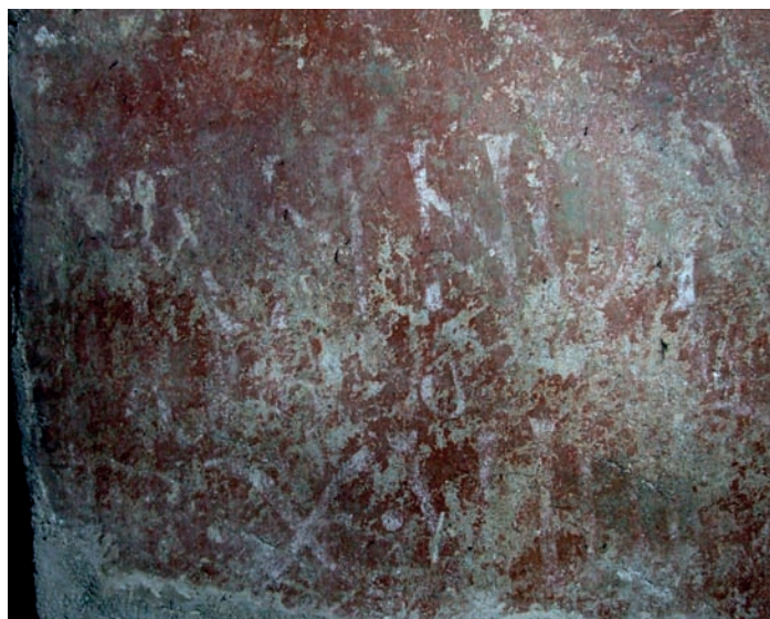
Fig. 4. Toulouse, Saint-Sernin, colateral nord de la nau, segon tram est, pilar est, cara oeste, inscripció (foto AMH) / Toulouse, Saint-Sernin, colateral norte de la nave, segundo tramo este, pilar este, cara oeste, inscripción (foto AMH).

A més, la torsió del cos de l'àngel (fig. 3) i el context narratiu de la Resurrecció recorden l'escena de les Santes Dones al Sepulcre. Es poden trobar exemples comparables en algunes obres classicistes, en les quals la roca del sepulcre es representa mitjançant una simple forma ondulada 13 i l'àngel fa el gest de parlar amb els dits estesos o amb el palmell obert. 14 El moviment de l'àngel podria indicar que les Santes Dones es trobaven al costat sud del pilar, seguint un procediment de narració contínua anàleg al de l'escultura de la Daurade. Per si això fos poc, la greca (a dalt) suggereix una continuïtat amb el costat sud del pilar: la franja