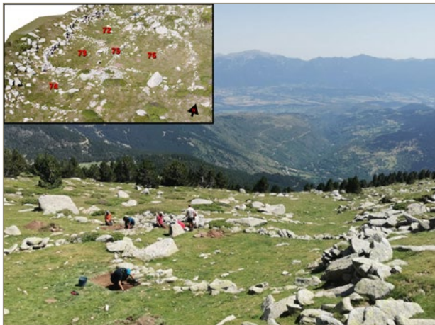
Figura 2. Treballs arqueològics al jaciment de Coll de Molleres II i fotografia amb la situació de les estructures.

tures entre les quals destaquen tres grans tancats (081, 083 i 086), un petit abric molt sedimentat (087), un conjunt de 4 tancats poligonals en terrasses (079, 082, 084 i 085) i una cabana (080). Es van dur a terme sondejos en 2 estructures (086 i 087). L'estratigrafia de l'estructura 086 no va permetre recollir cap mostra útil per a realitzar datacions de 14 C. Tampoc es va recuperar cap resta de cultura material. L'estructura 087 es va excavar en extensió, registrant una seqüència estratigràfica de fins a 70 cm de potència. En aquest cas, tampoc es va recuperar cap fragment ceràmic. La datació radiocarbònica feta sobre carbó recuperat en l'únic nivell d'ocupació de l'abric mostra un ús contemporani d'aquest espai (segles XVIII-XIX dC).