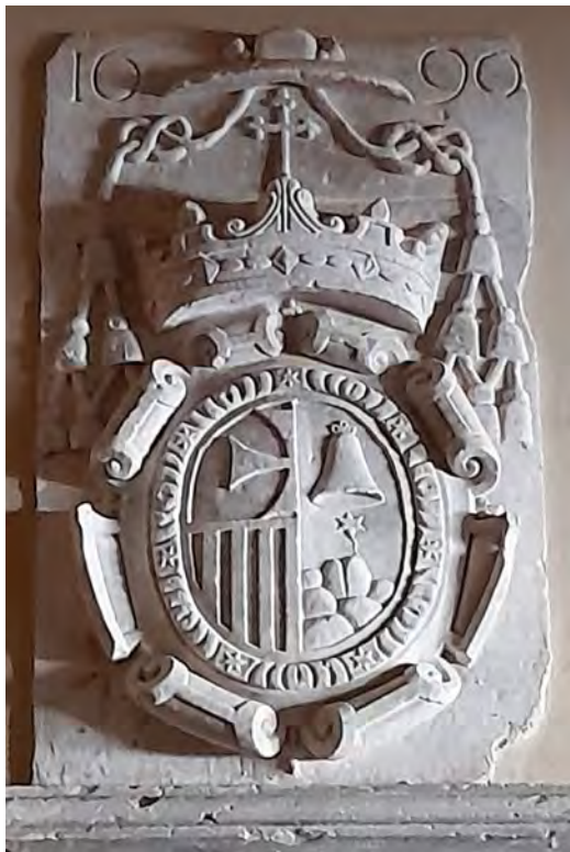
Figura 1. Escut de Josep Sanchis i Ferrandis al saló de sessions de la Diputació de Tarragona.