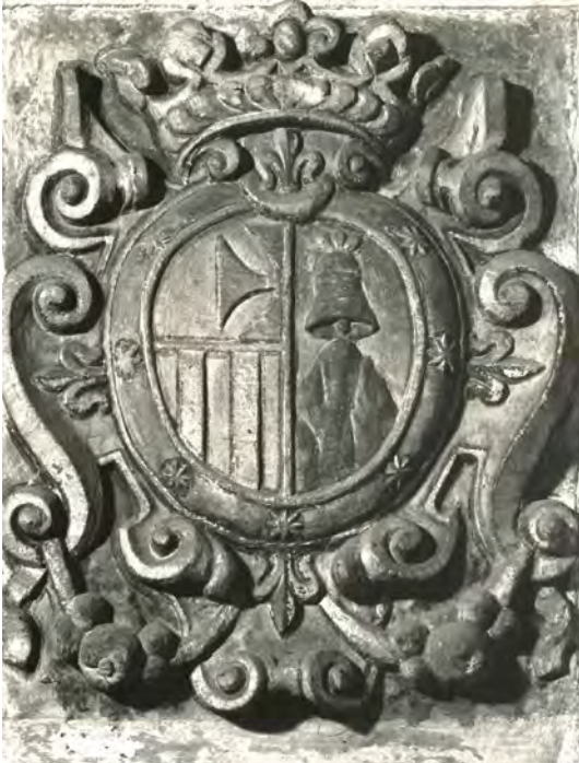
Figura 3. Escut de Josep Sanchis i Ferrandis procedent del convent de la Mercè de Barcelona. MNAC.