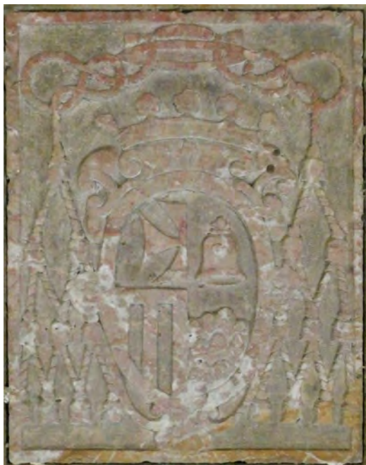
Figura 2. Escut de Josep Sanchis i Ferrandis a la seva làpida sepulcral al presbiteri de la catedral de Tarragona.