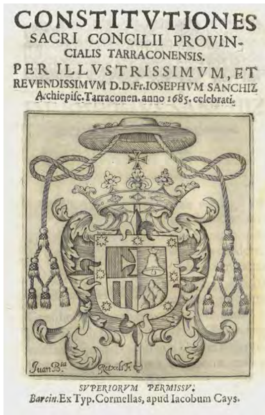
Figura 5. Escut de Josep Sanchis i Ferrandis a la portada de les Constituciones sacri concilii provincialis Tarraconensis... 1685.