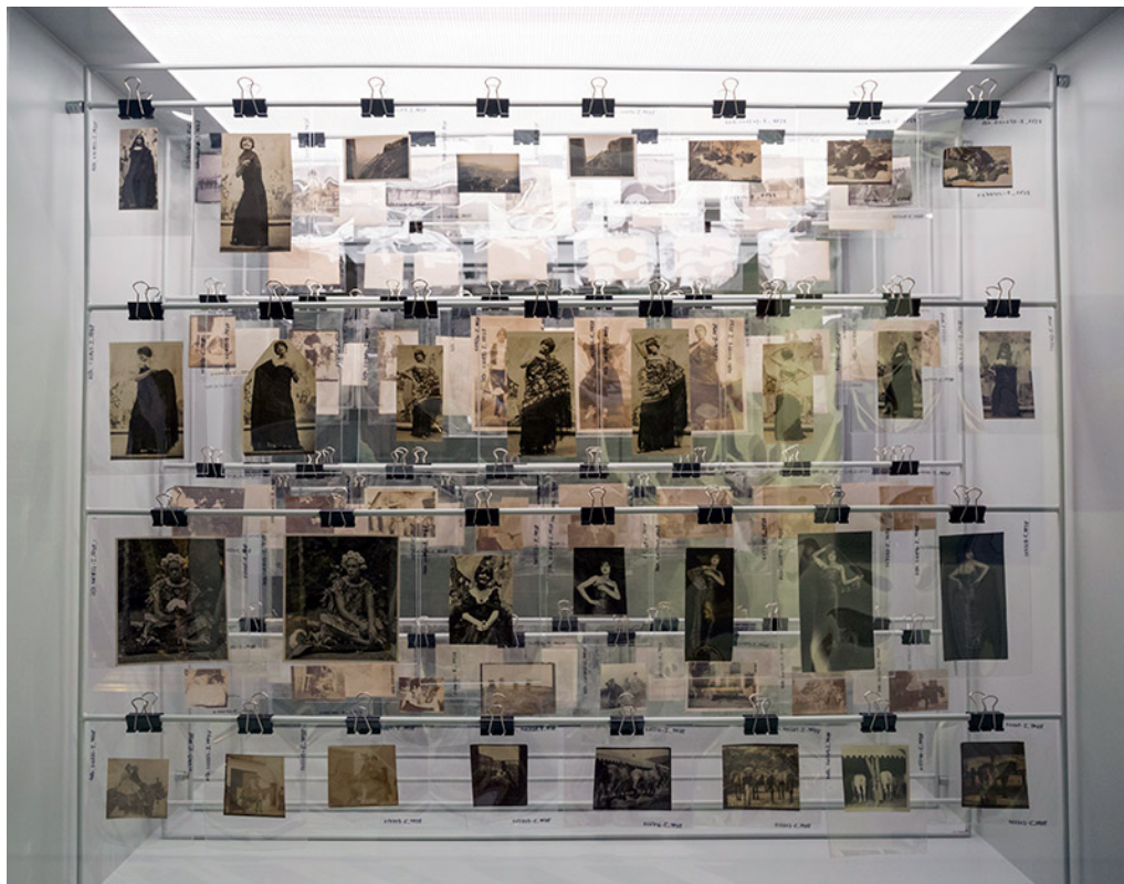
AMNAC. Vista de presentació del fons fotogràfic d'Anglada Camarasa a l'exposició Anglada Camarasa: l'arxiu premeditat, 2023. 2023