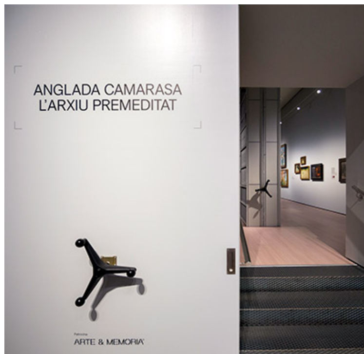
Vista de l'entrada a l'exposició Anglada Camarasa. L'arxiu premeditat. 2023

En l'exposició es va destacar la singularitat d'un dels artistes catalans més internacionals del país i de la interpretació i significança del seu arxiu personal: una eina al servei de la dignificació de la seva obra i de la seva carrera artística. Però també un instrument que permetia la seva projecció en el futur.