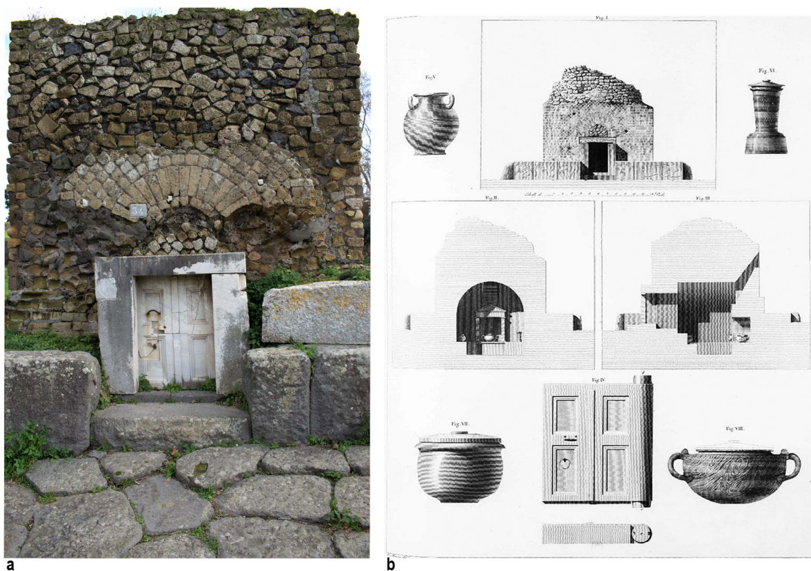
Figura. 5 a) Tomba 34 ‘dalla porta di marmo’, Necropoli di Porta Ercolano, Pompei ; b) disegno con i ritrovamenti dalla tomba nel 1813.