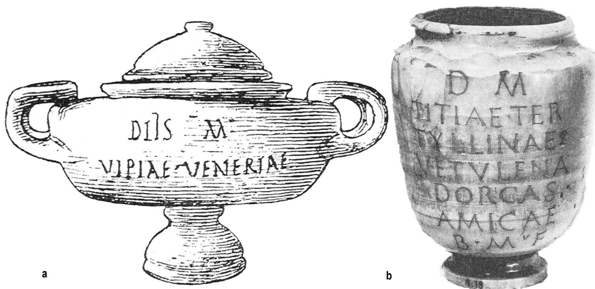
Figura. 6 a) Disegno della zuppiera C di Ulpia Veneria da Alessandria, attualmente dispersa (© Breccia 1914: 61 no. 12); b) foto di urna a vaso 'canopico' di Titia Tertyllina , San Pietroburgo, Ermitage (©Favaretto 1978: 100).

collezionista russo Shuvalov nel 1777 e da lì probabilmente finì all'Ermitage di San Pietroburgo, dove fu rintracciata dalla studiosa Irene Favaretto alla fine degli anni 70. 66