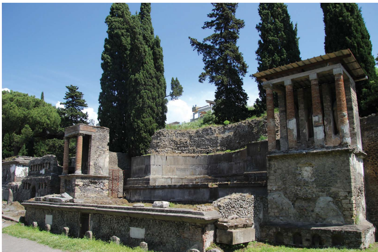
Figura 9. La tomba della sacerdotessa e imprenditrice Eumachia a Pompei, Necropoli di Porta Nocera (epoca Augustea), singolare per la sua mole e sfarzo e idonea a commemorare il ruolo rivestito dalla defunta all'interno della società pompeiana.