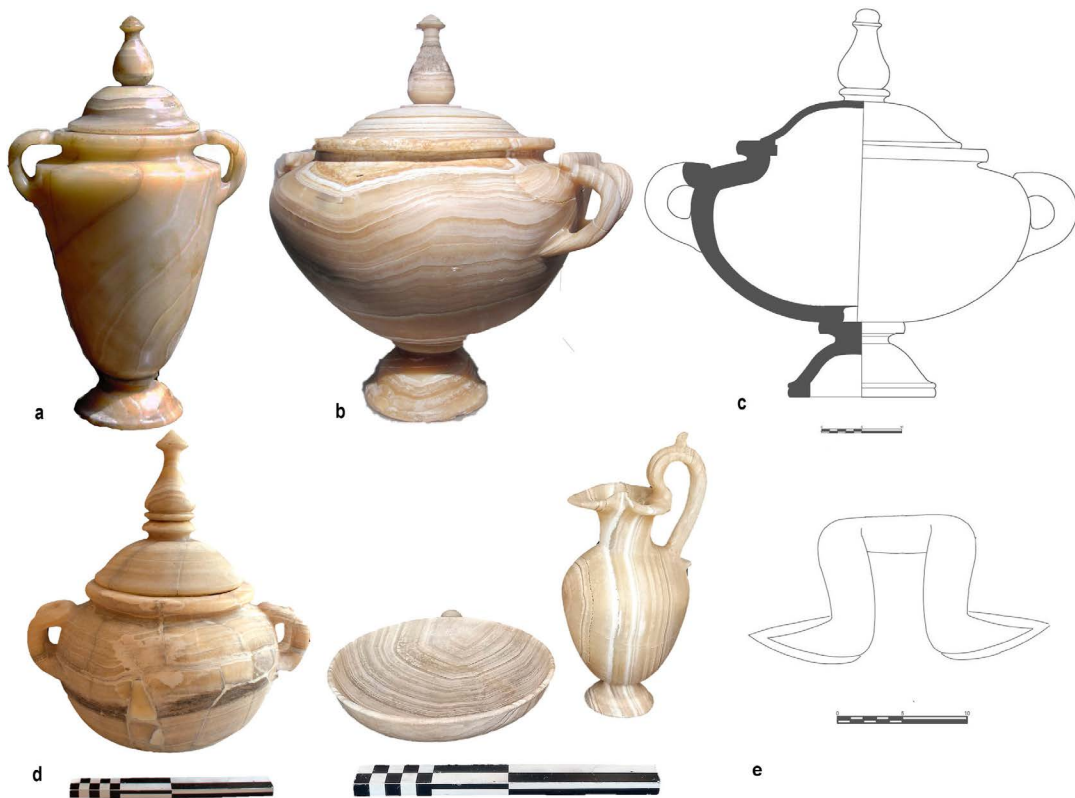
Figura 1 a) Zuppiera A, Roma Collezione privata (©cortesia Dario Del Bufalo); b) zuppiera B dalle Tre Fontane, Roma Museo Nazionale Romano, Palazzo Massimo, Storage rooms. Inv. 135737 (By Sailko - Own work, CC BY-SA 3.0, https://commons.wikimedia.org/w/index.php?curid=31975754 ); c) disegno con sezione di una zuppiera tipo C (©Autrice); d) zuppiera B da Montpellier e due altri vasi di alabastro facenti parte del suo corredo, Lione Museo des Beaux Arts Inv. H 2220, 2221, 2222 (©Autrice); disegno del dettaglio del tipico attacco inferiore dell'ansa a foglie lanceolate delle urne a zuppiera (©Autrice).