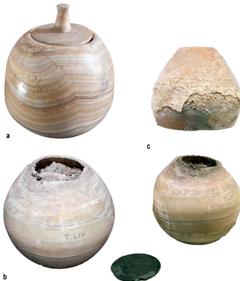
Figura 8- a) Vaso 'canopico' di Verginius Paetus , fine I secolo a.C.- inizi I secolo d.C., Museo Archeologico Nazionale, Sarsina Inv. 494 (©Autrice su concessione del Ministero della Cultura – Direzione regionale Musei dell'Emilia-Romagna. Divieto di ulteriore riproduzione o duplicazione con qualsiasi mezzo); b) vaso 'canopico' globulare da sepoltura a lato del monumento Verginius Paetus , fine I secolo a.C.- inizi I secolo d.C.(?), Museo Archeologico Nazionale, Sarsina, Inv. 115 (©Autrice su concessione del Ministero della Cultura – Direzione regionale Musei dell'Emilia-Romagna. Divieto di ulteriore riproduzione o duplicazione con qualsiasi mezzo); c) corredo del vaso 'canopico' globulare Museo Archeologico Nazionale, Sarsina Inv. 115 (©Autrice su concessione del Ministero della Cultura – Direzione regionale Musei dell'Emilia-Romagna. Divieto di ulteriore riproduzione o duplicazione con qualsiasi mezzo).

a contenere i resti di un letto funerario in osso decorato, dettagli questi che sembrano ulteriormente sottolineare l'importanza di questa donna all'interno del nucleo familiare. 92