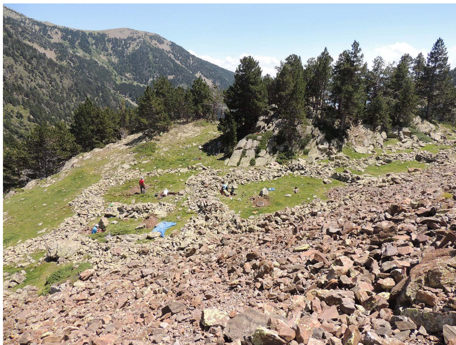
Figura 4. Vista general dels treballs arqueològics a les estructures 35, 36 i 37 al jaciment de Duran II, la Cerdanya (2020).

alta resolució, tant dels sondejos com de les estructures i de l'extensió total dels jaciments.