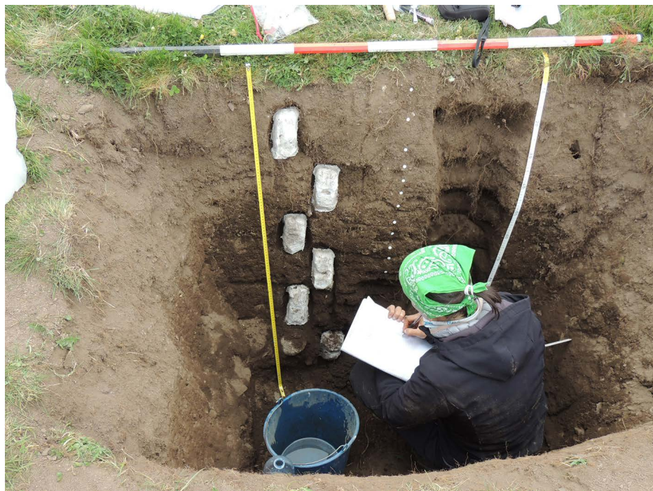
Figura 6. Cala pedològica per a la presa de mostres pedoantracològiques, palinològiques i micromorfològiques en els sòls col·luvials als encontorns de l'estany del Malniu, la Cerdanya, a 2150 m (2021).

successió d'horitzons pedològics. Una vegada les mostres es troben al laboratori, aquestes es tamisen amb aigua o es floten amb malles de 4, 2, 0,4 i 0,8 mm. A continuació, es pesen els fragments de carbó per calcular l'antracomas específic i s'identifiquen per al reconeixement de l'espècie 4 . És recomanable que l'anàlisi pedoantracològica vagi sempre acompanyada d'un estudi micromorfològic i palinològic de les mateixes mostres, ja que la informació obtinguda d'aquestes darreres anàlisis permetrà comprendre millor els processos de formació i transformació