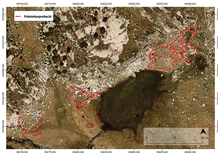
Figura 2. Exemple de treballs de fotointerpretació al jaciment de la Bassa, a l'oest de la zona d'Engorgs (la Cerdanya). Aquesta tasca es realitza a partir de fotografies aèries d'alta definició. Les possibles estructures es digitalitzen sobre una capa vectorial, que després serà corroborada sobre el terreny (prospecció: ETRS 89. UTM 31 N).

d'estudi en una quadrícula que ha de tenir una mida prou bona perquè el quadre d'anàlisi permeti realitzar una visualització de la fotografia aèria en la màxima resolució i sense arribar a causar deformacions a les dimensions del píxel (Orengo, 2010). A partir d'aquí s'aplica una anàlisi visual i sistemàtica sobre les diverses capes de la base cartogràfica. En una capa vectorial es defineixen totes les possibles estructures antròpiques que hi poden ser detectades. Aquest primer diagnòstic ens permet avaluar la potencialitat arqueològica de les zones d'estudi i realitzar una planimetria prèvia de les estructures arqueològiques visibles des de l'aire, definint així les àrees d'un interès arqueològic més gran.