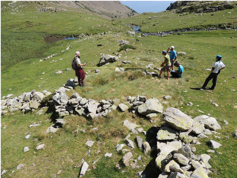
Figura 3. Treballs de prospecció arqueològica a Engorgs, la Cerdanya (2020), on es pot observar el procés de documentació d'una estructura.

L'objectiu recau a inventariar el conjunt de traces i «signes» arqueològics relacionats amb l'activitat humana a l'alta muntanya. Les estructures localitzades són definides a les fitxes de camp, al mateix temps que són incorporades als formularis del receptor GPS de mà (figura 3). Això permet complementar i modificar la