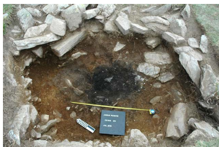
Figura 5. Llar de foc neolítica amb carbons documentada sota l'estructura 346 del jaciment d'Aigols Podrits, Vall de Núria (2016).

El mostreig implica, sempre que sigui possible, l'extracció d'aproximadament 4 L de sediment per tamisar-lo amb aigua o flotació utilitzant malles de 4, 2, 1 i 0,25 mm (Euba, 2009). Segons Chabal (1994), el nombre òptim de fragments per identificar ha de ser entre 250 i 400 fragments provinents d'un tamisatge amb una malla de \geq 4 mm. En una gran altitud, com són les cotes subalpines i alpines, la riquesa de vegetació específica és més modesta. Per aquest motiu, el nombre òptim de fragments que se'n poden analitzar pot ser menor, d'entre 50 i 100 fragments \geq 2 mm. També és recomanable utilitzar-hi la malla més fina, a causa