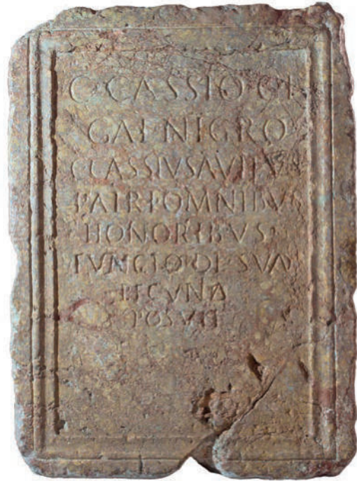
Figura 3. Pedestal en broccatello de Dertosa ( CIL II 2 /14, 791).

Aunque no es usual, su empleo como soporte epigráfico está también documentado, especialmente en Dertosa , tanto para pedestales como para otros tipos epigráficos ( CIL II 2 /14, 783, 386, 388, 791, 794-796, 803) (fig. 3). 9 Su uso como soporte también se