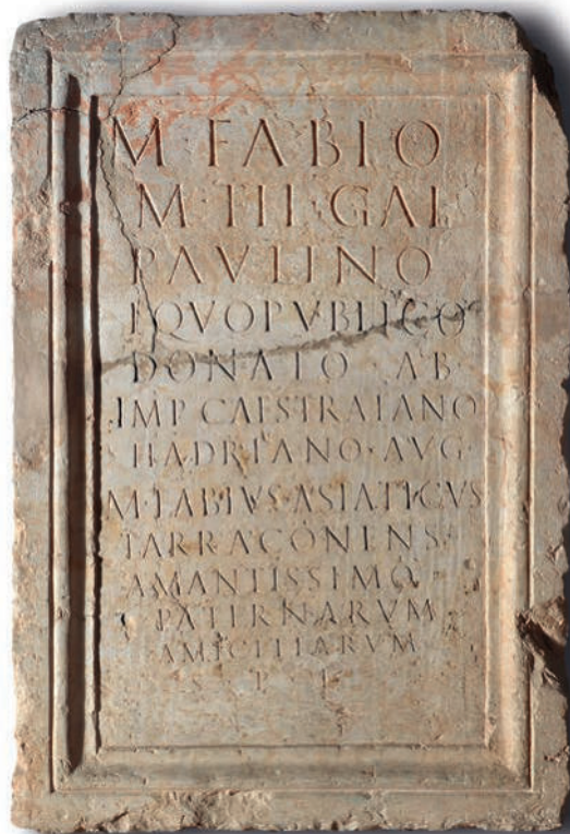
Figura 2. Ejemplo de típico neto de pedestal tripartito monolítico en piedra de Santa Tecla de la officina lapidaria a partir de época flavia (CIL II 2 /14, 1028).

De ser cierta esta segunda opción, la inclusión de la origo en la forma adjetivada Uxamensis sería esperable en el caso de una inscripción realizada fuera de la comunidad del homenajeado, 6 incluso fuera de su correspondiente circunscripción administrativa, como es este caso. La colocación de la origo debería situarse a continuación de la filiación, ya que es la posición habitual en las inscripciones que documentan personajes oriundos de Uxama . 7 Sin embargo, tratándose aquí de una inscripción honorífica expuesta en un lugar como el foro, es preferible pensar que tras la filiación se encontrase la tribu correspondiente, la Galeria (Fassolini, 2012: 468-469). La posición de la secuencia XA a final de la línea dos permite confirmar esta hipótesis. De ser así, en las dos primeras líneas del texto se debería haber alojado los tria nomina del personaje, quizá seguido de la tribu y la origo . El resto del texto es difícil de precisar a partir de los restos de letras conservadas, pero es muy probable que conti-