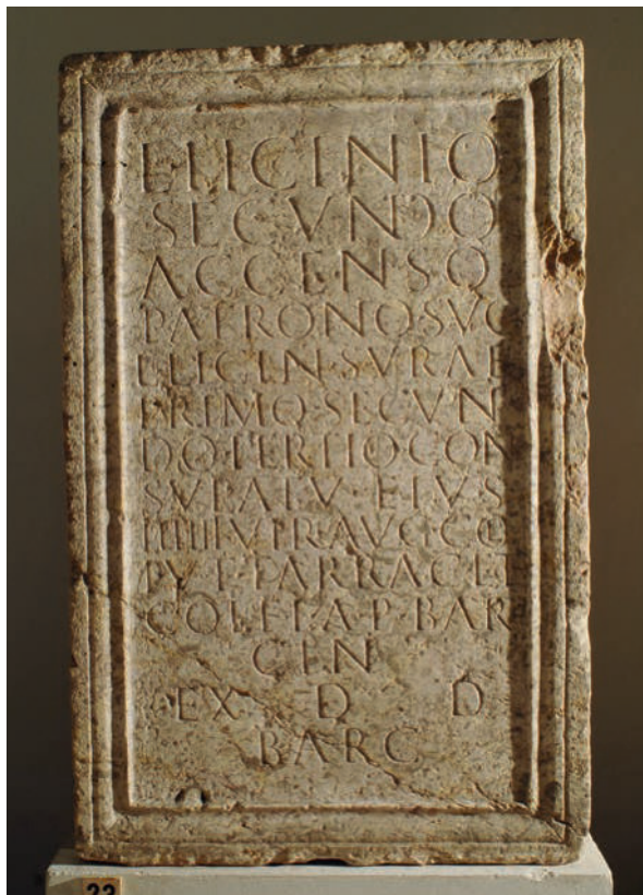
Figura 4. Pedestal en broccatello de L. Licinius Secundus de Barcino ( IRC IV , 86).

terísticas del ejemplar caesaraugustano ( CIL II 2 /14, 1193, del 174 d.C.). 10