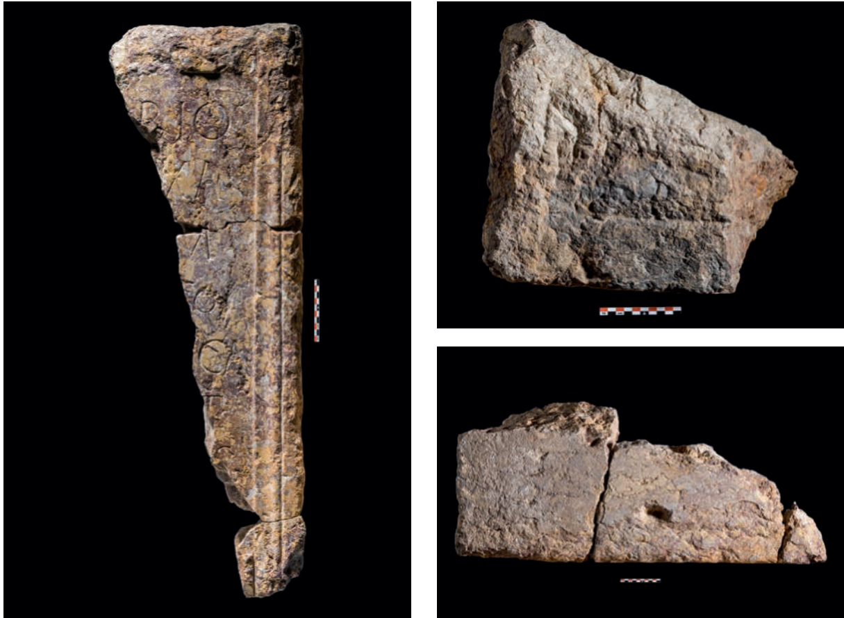
Figura 1. Nuevo pedestal de Caesar Augusta . Izquierda, vista frontal. Derecha, partes superior y dorsal.

Esto parece quedar refrendado también por el hecho de que el final de la palabra de la primera línea, que debería corresponder al nombre del personaje, está declinado en caso dativo, propio de los homenajes. La praxis de los textos oficiales documentados en otros pedestales honoríficos de este tipo, especialmente en Tarraco , confirma que la fórmula onomástica completa del individuo (con indicación de filiación y cognomen ) acostumbra a estar seguida de la mención de las tribus y la origo , elementos que suelen aparecer en las dos primeras líneas. Lamentablemente, el escaso texto conservado no permite realizar ninguna restitución completa. No obstante, dada la sistematicidad de las fórmulas halladas en los ejemplares tarraconenses, creemos poder presentar una hipótesis para poder entender su contenido.