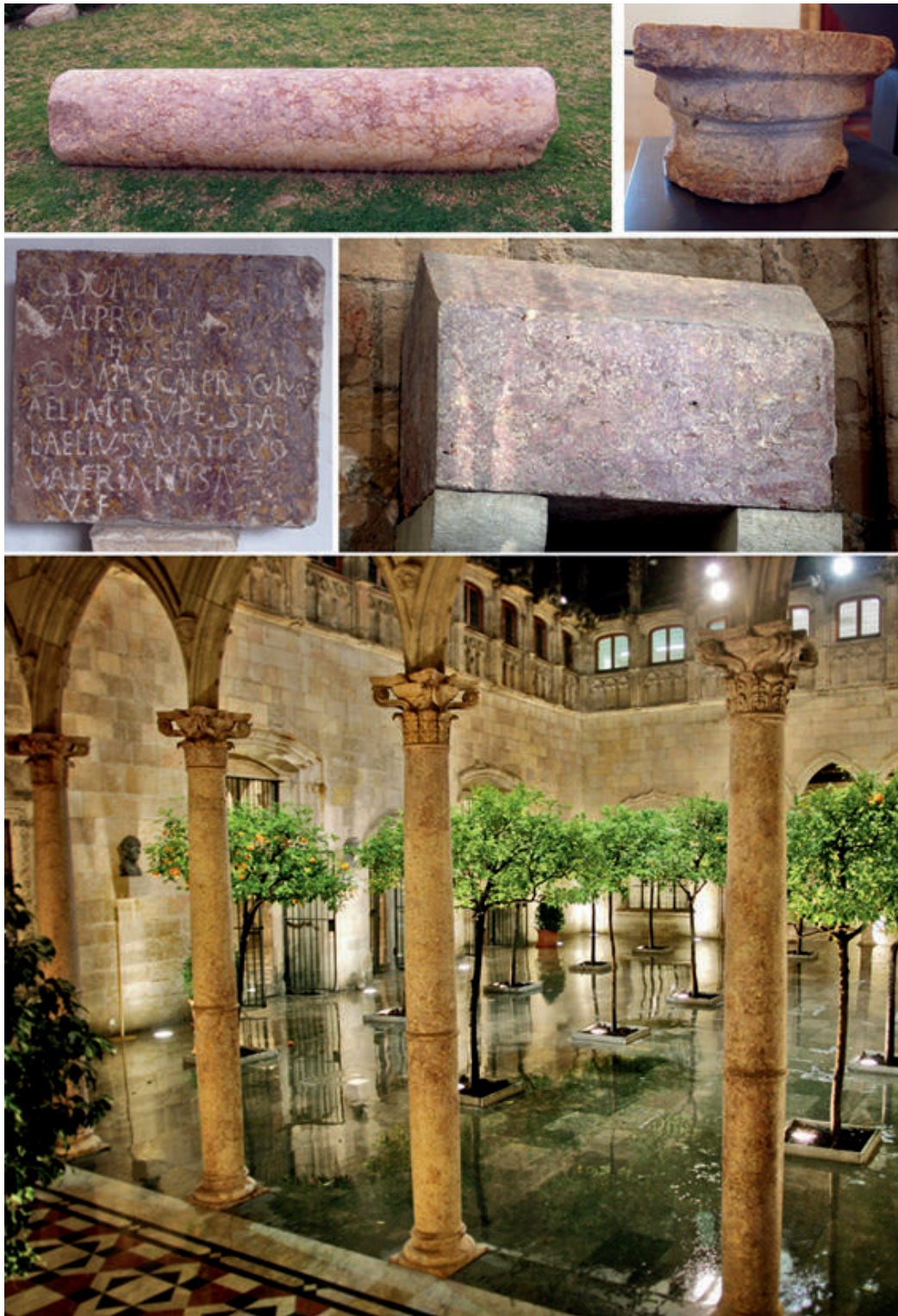
Figura 1. Diversos exemples de peces en broccatello : columna i capitell romans conservats al Turó de la Suda, Tortosa (a dalt); inscripció de Lesera, Castelló, i sarcòfag del bisbe Paulac al claustre de la catedral de Tortosa, datat de 1316 (al centre); columnes del Pati dels Tarongers, Generalitat de Catalunya (a baix).