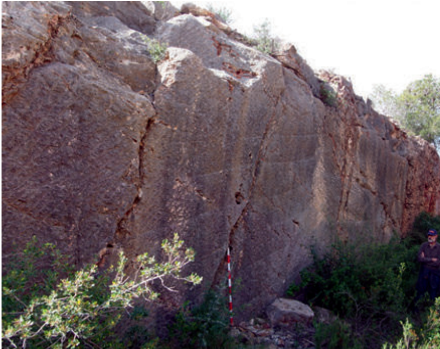
Figura 2. Pedrera dels Valencians, Tortosa (vista d'un front).