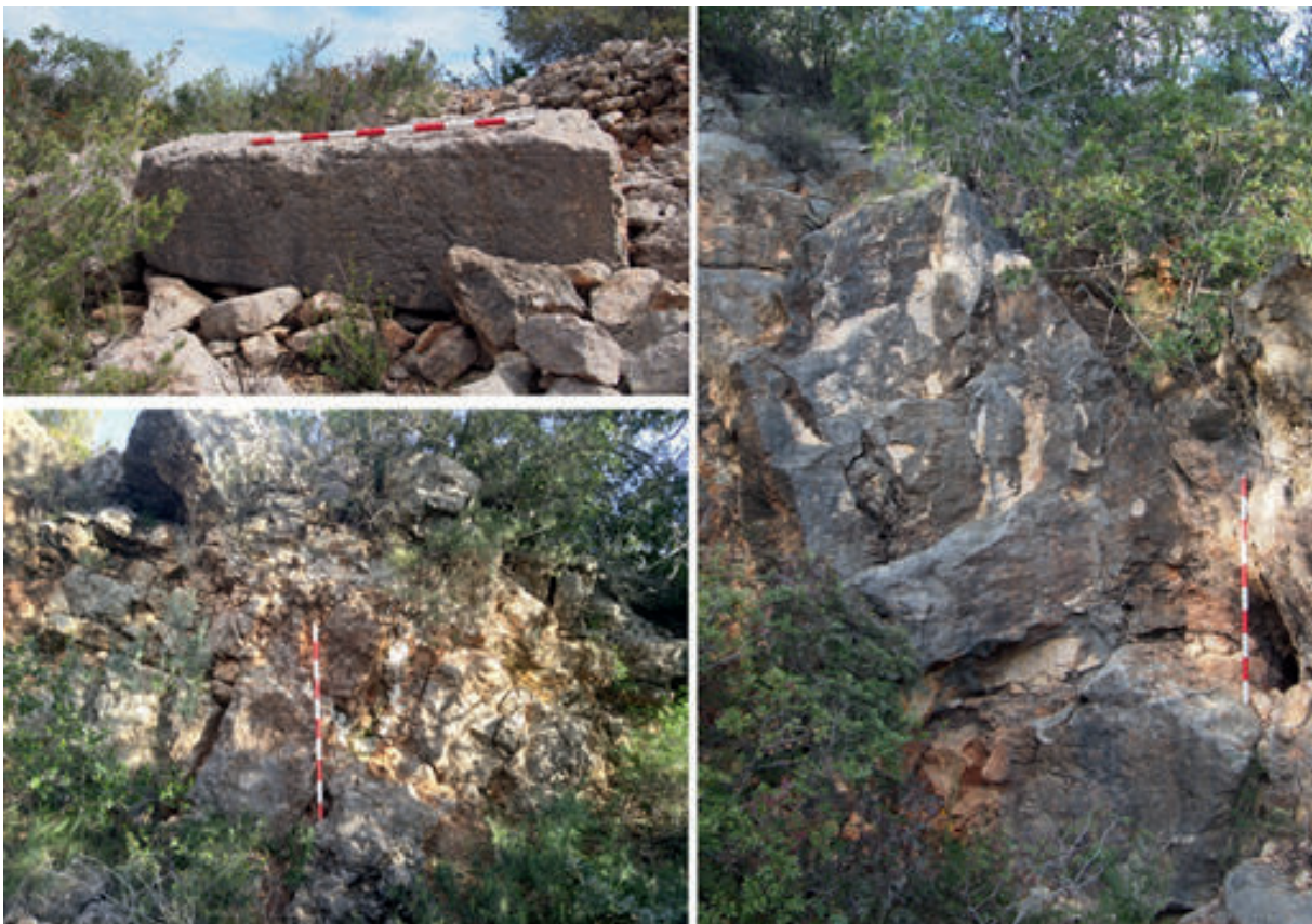
Figura 3. Noves pedreres localitzades al Barranc de la Llet: bloc abandonat en pedrera 11 i vistes dels front de les pedreres 14 i 13 (de dalt a baix i d'esquerra a dreta).