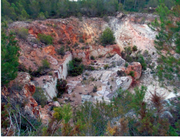
Figura 5. Pedrera de Mas Frauquet, Tivissa (vista general).

tensiva, en 2 grans bancals, malgrat que la roca apareix fortament diaclasada, cosa que en dificulta l'extracció de grans blocs.