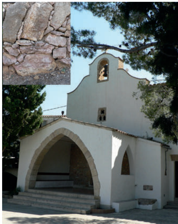
Figura 4. Ermita de la Petja i detall de blocs irregulars de broccatello utilitzats als seus entorns.

Sortint dels entorns directes de Tortosa, però, existeixen igualment indicis clars de l'explotació de broccatello . Es tracta de la Pedrera de Mas de Frauques (Tivissa), a uns 25 km a NE de Tortosa en línia recta, de la quan se'n té constància d'explotació al segle s. XVIII: