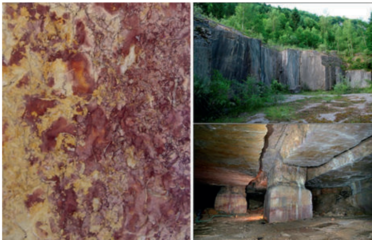
Figura 6. Placa del Musée du Marbre (Bagnères-de-Bigorre, França) amb l'aspecte del broccatelle violette de Jura (esquerra; foto: els autors) i vistes de la pedrera de Chassal (imatges de http://tchorski.morkitu.org/13/chassal.htm ).

el registre arqueològic i patrimonial medieval no sigui especialment ric en peces de broccatello i, per tant, poc probable que s'obrissin nous fronts d'extracció, fa pensar que potser es tractaria d'un indret podria haver existit una explotació anterior —potser antiga?—. Menys clara és el possible inici de l'explotació a la pedrera de Tivissa. Sense indicis clars de presència antiga als seus entorns i amb una situació molt menys avantatjosa que la de les pedreres de Tortosa —que es troben a una distància mínima respecte la magnífica via de transport que és el riu Ebre—, es fa difícil pensar en una explotació massa anterior a la que marca la documentació escrita (s. XVIII). No obstant, ambdós casos permeten confirmar que la zona d'aprofitament de l'afiorament geològic que proporciona broccatello és major a la que fins ara es coneixia i que és possible que part de les peces d'època moderna elaborades en broccatello fossin elaborades amb material de Tivissa, i no tortosí.